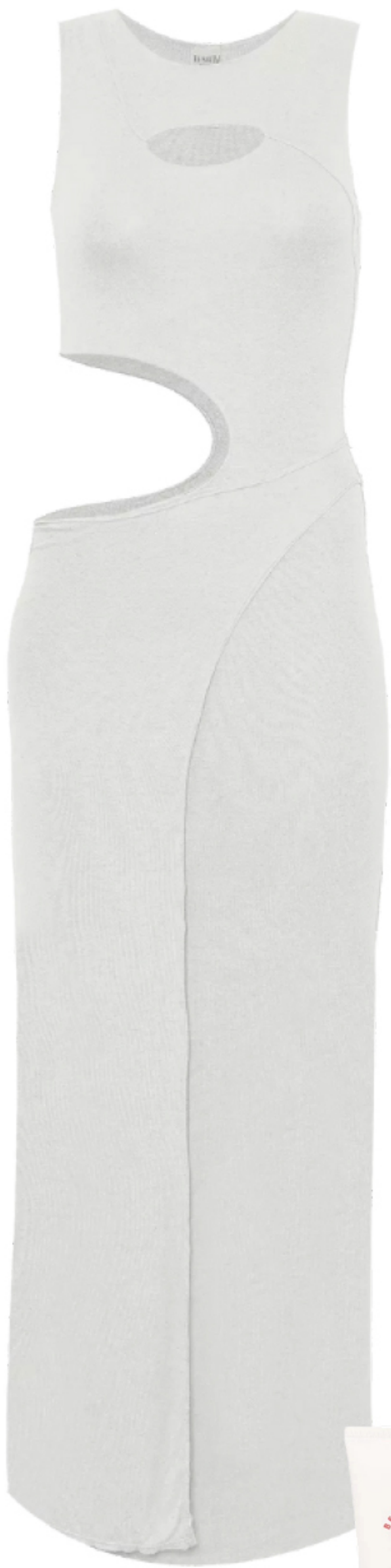
TESWIM, R$ 896