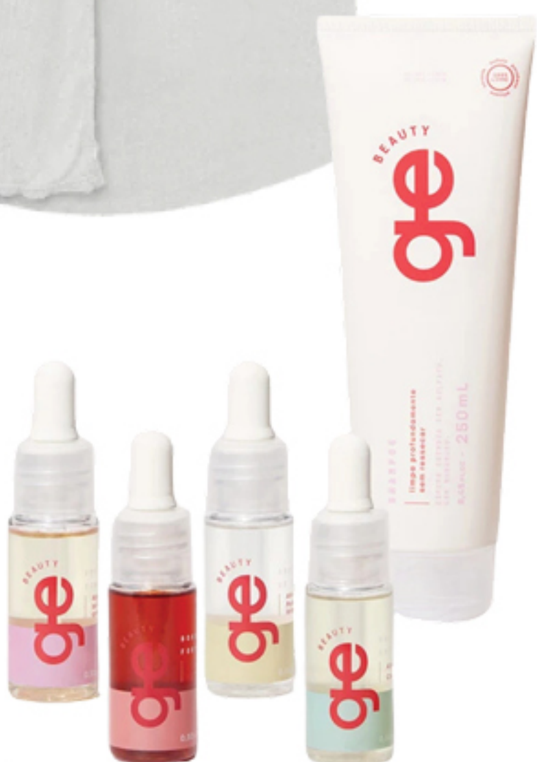
KIT GE, DE: R$ 358,50 POR: R$ 340,57