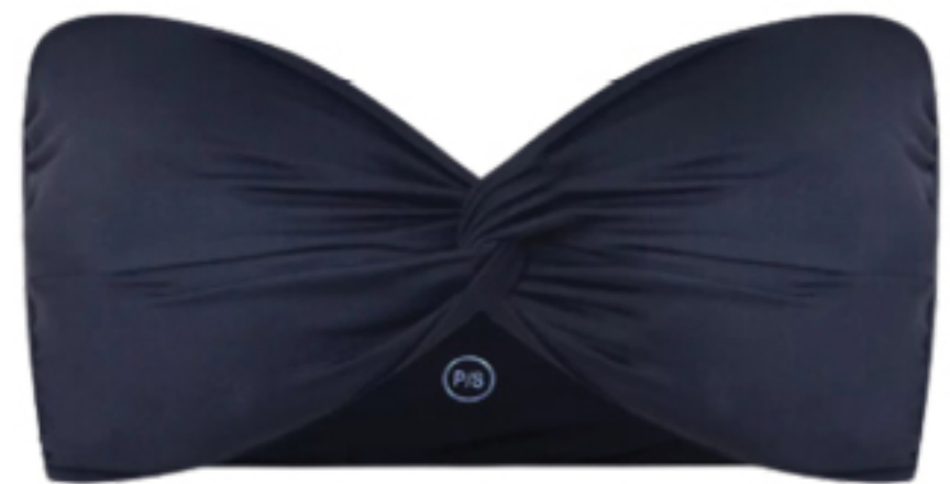
LOER, R$ 598