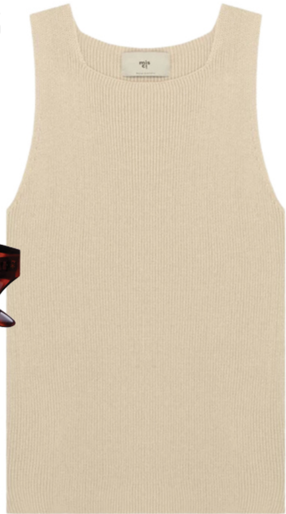
MISCI, R$ 810