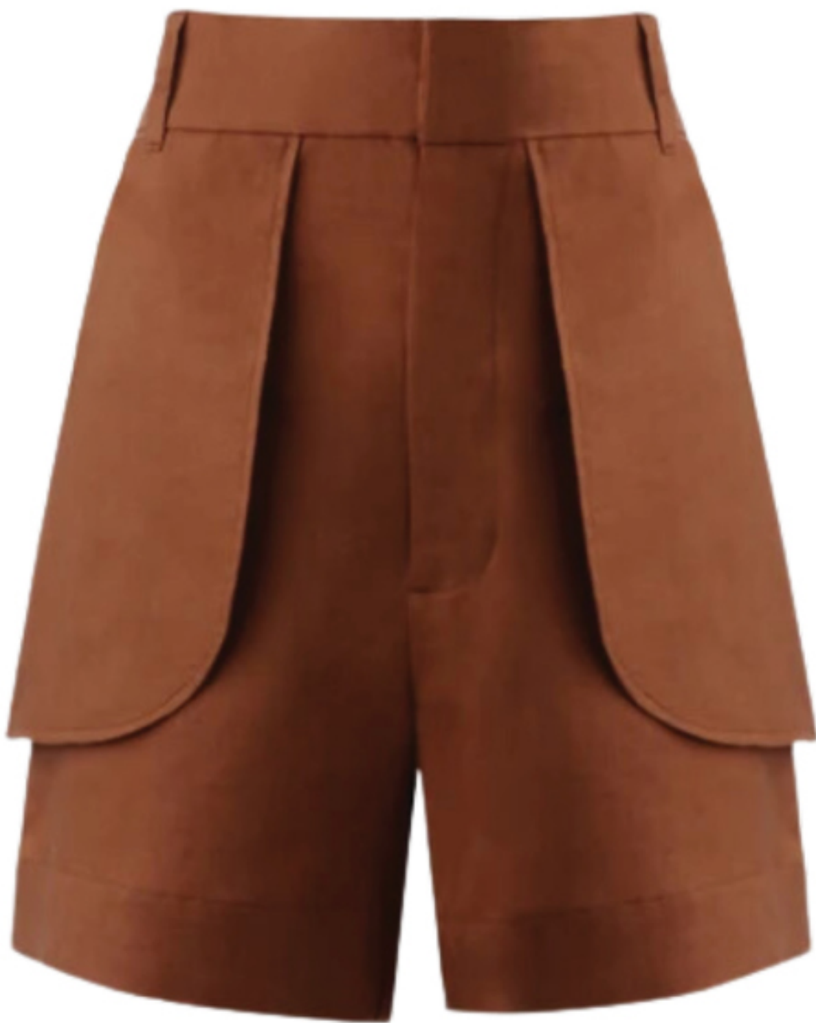
MISCI, R$ 890