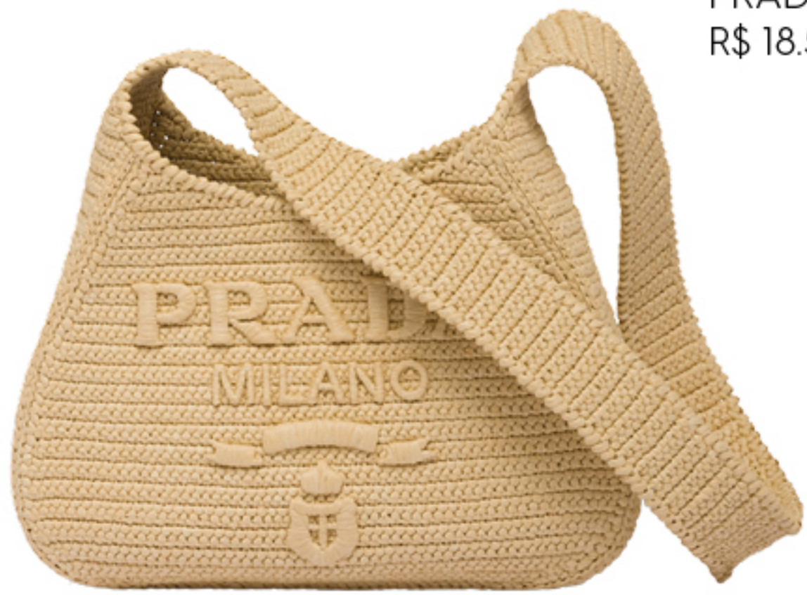
PRADA, R$ 18.500