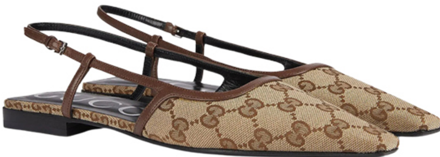
GUCCI, R$ 4.760