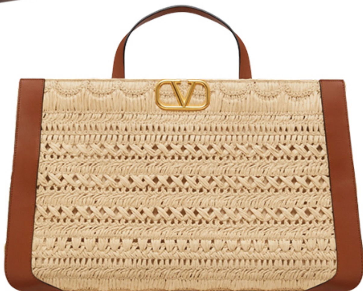
VALENTINO, R$ 17.300