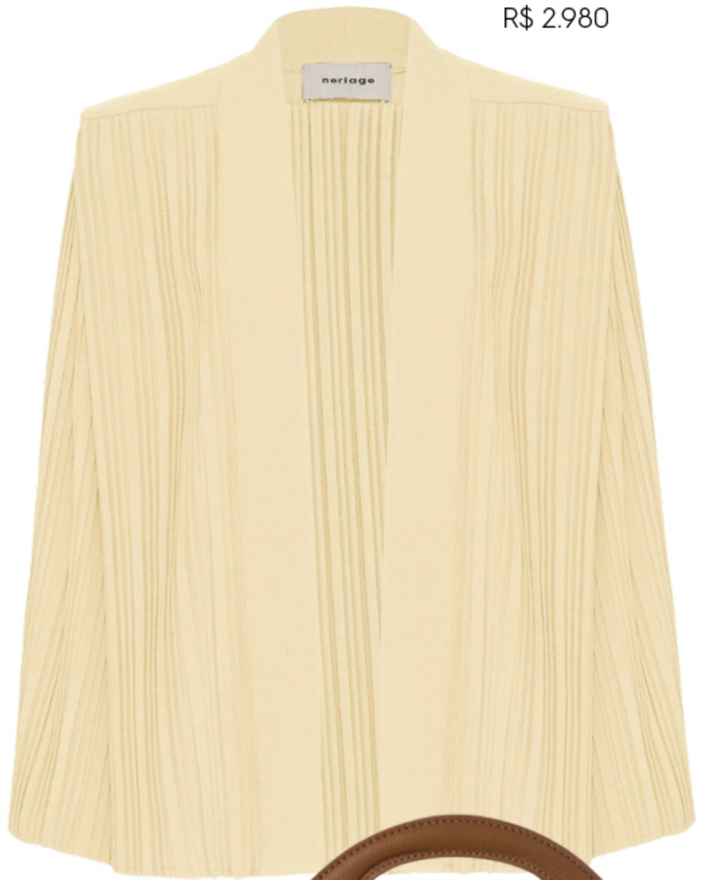
NERIAGE, R$ 2.980