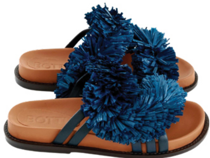
BOTTI, R$ 1.680