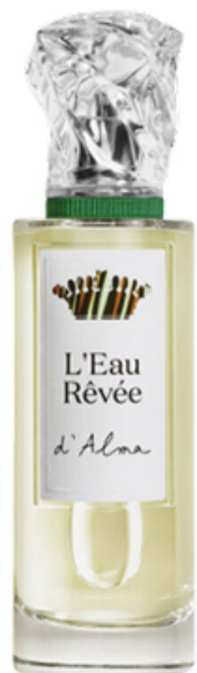
SISLEY PARIS, R$ 920