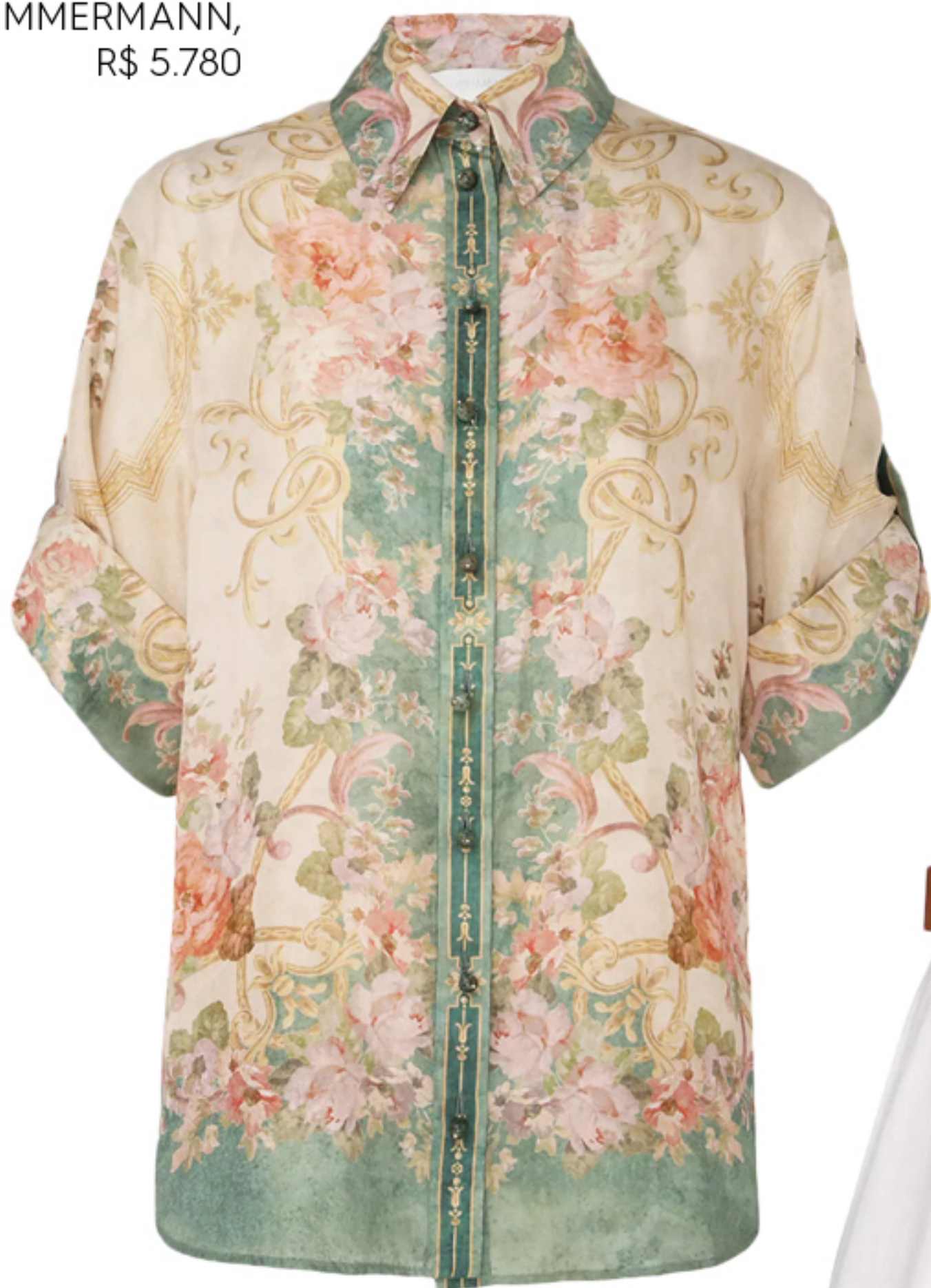
ZIMMERMANN, R$ 5.780