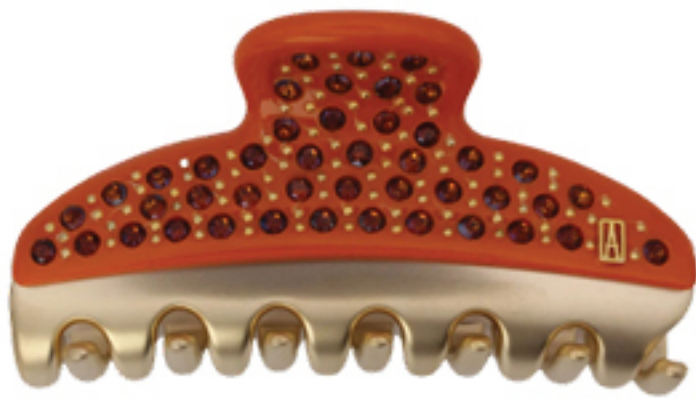
ALEXANDRE DE PARIS, R$ 850