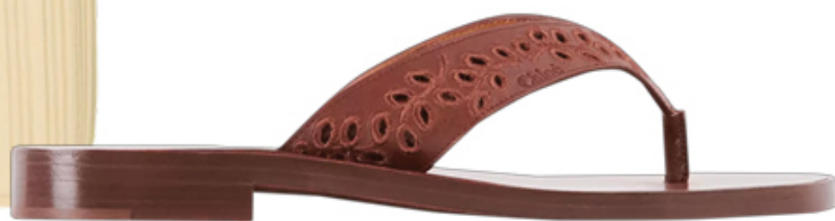
CHLOÉ, R$ 4.940