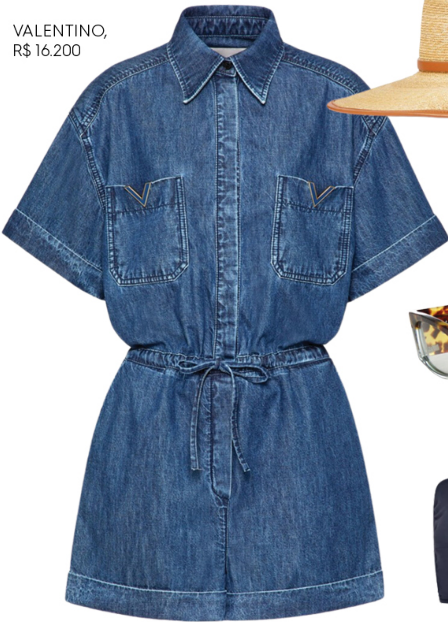
VALENTINO, R$ 16.200