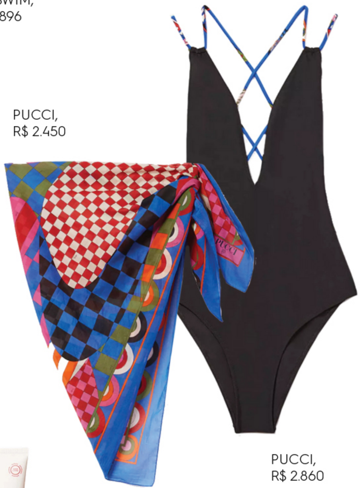
PUCCI, R$ 2.450