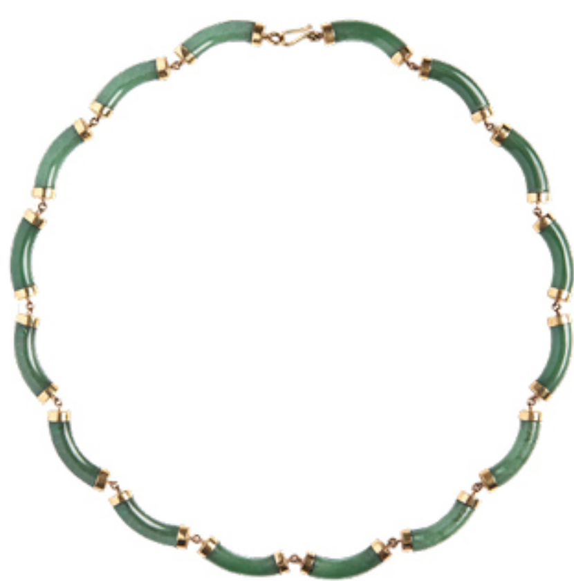
MARINA VICINTIN, R$ 12.408