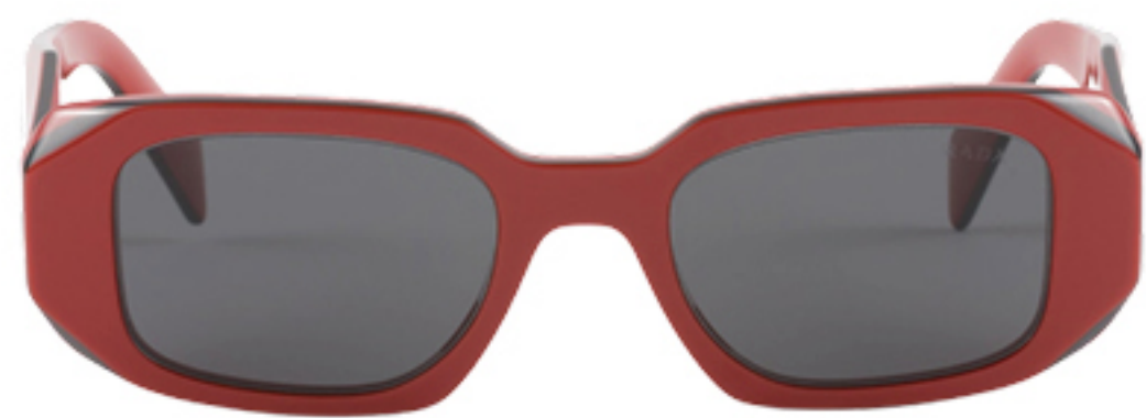
PRADA, R$ 2.650