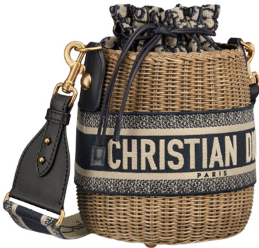
DIOR, R$ 36.500