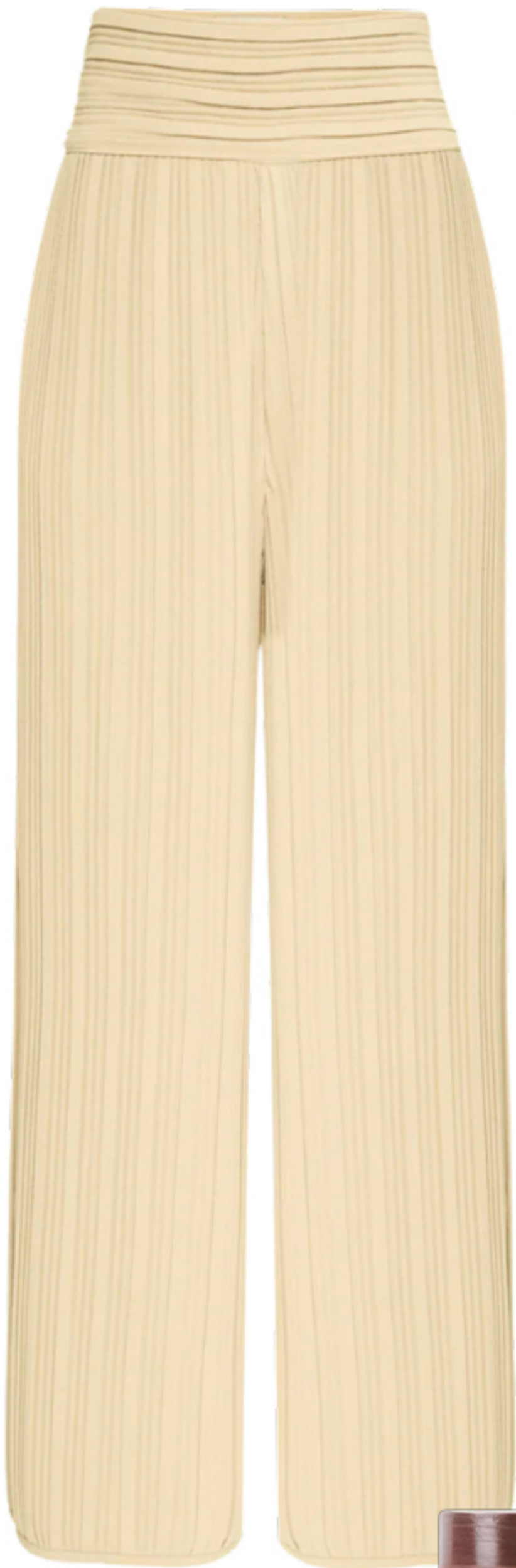
NERIAGE, R$ 2.180