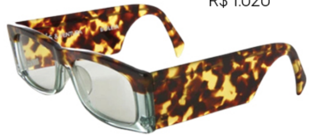
MISCI, R$ 1.020