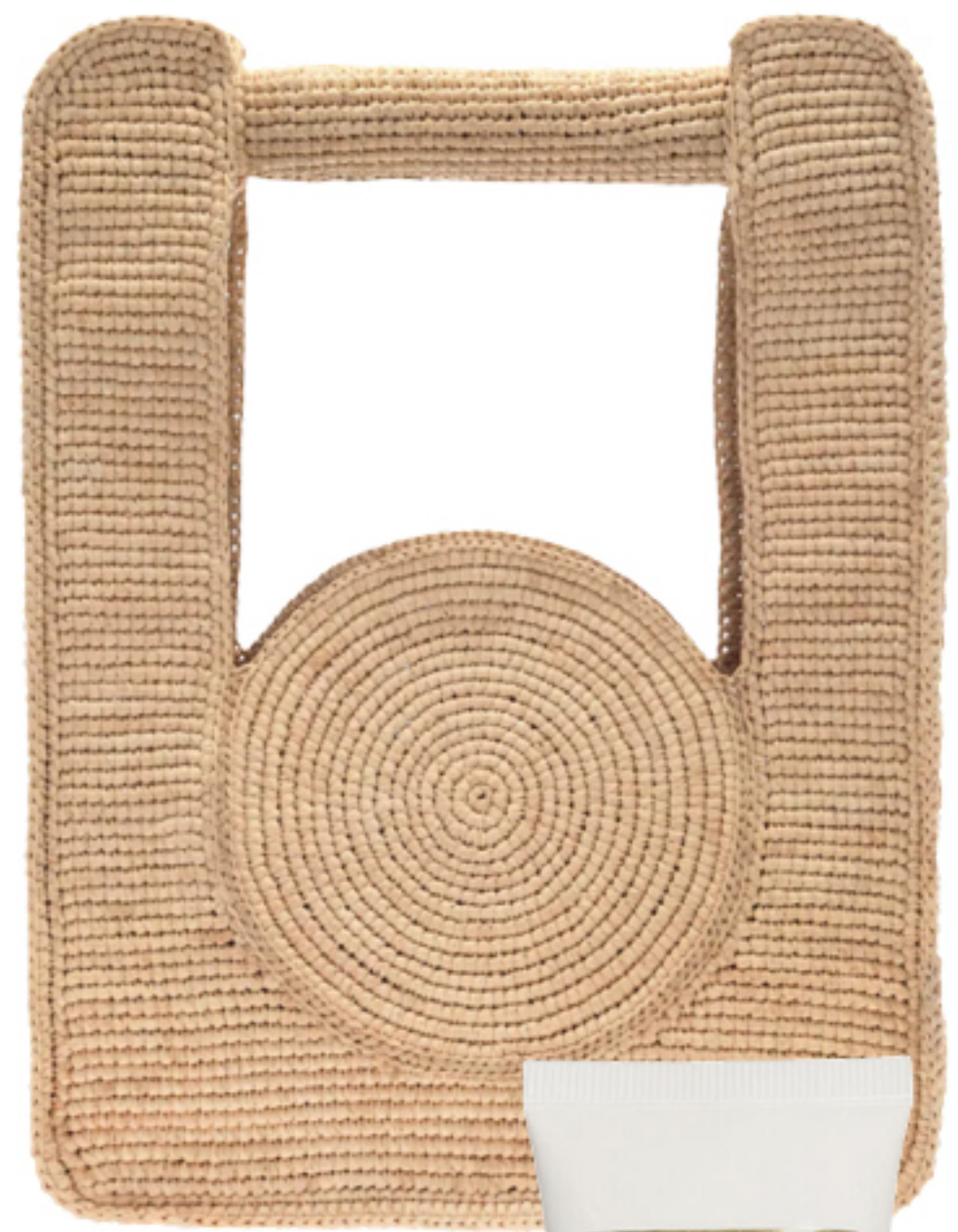
NERIAGE, R$ 2.800