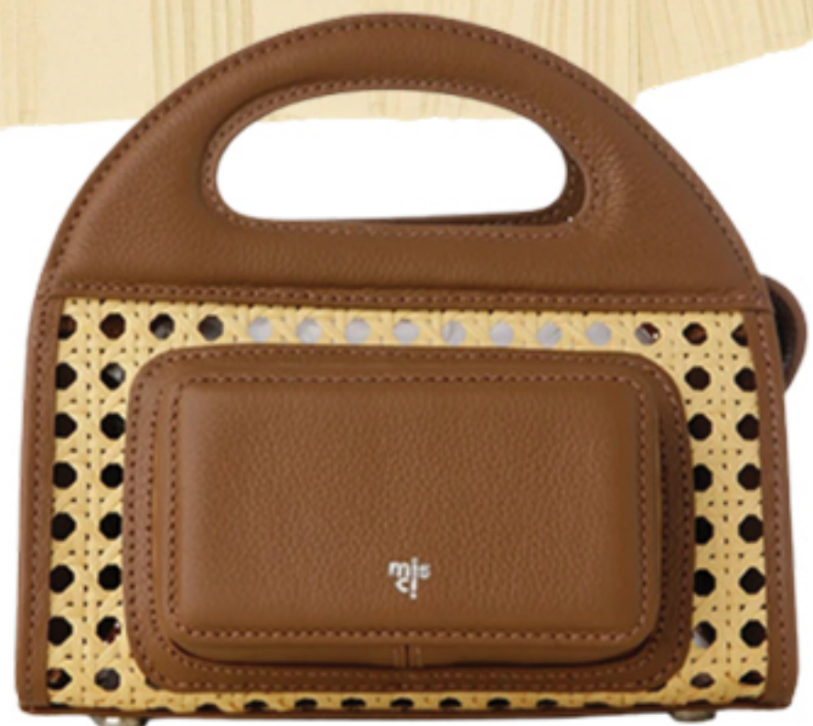
MISCI, R$ 2.800