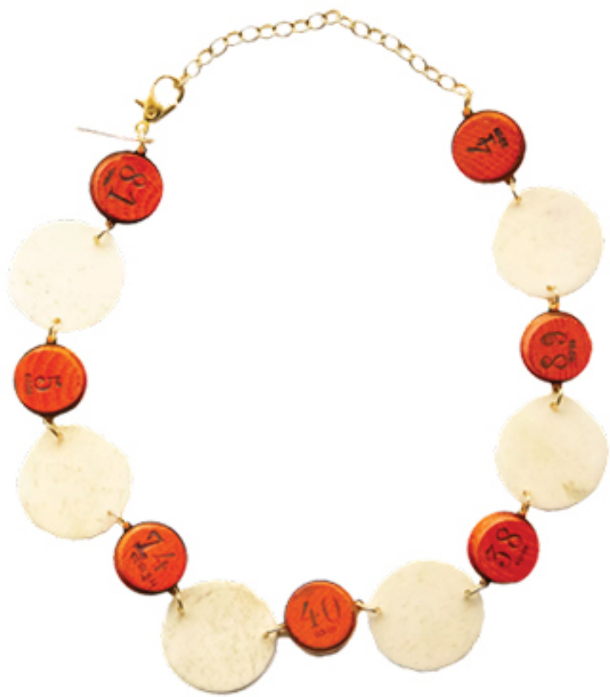
HISTORY.CALL NA AD STUDIO, R$ 2.880