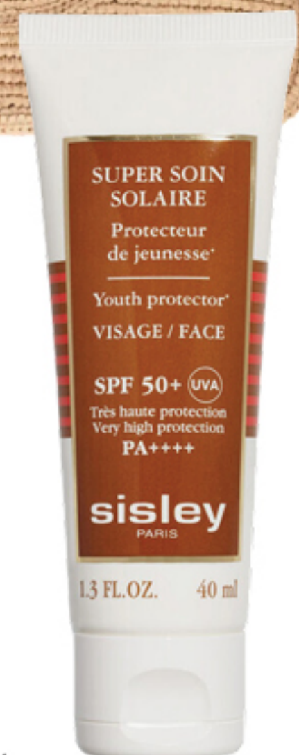
SISLEY PARIS, R$ 1.590