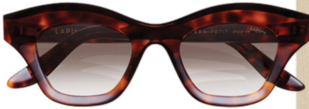
LAPIMA, R$ 2.970