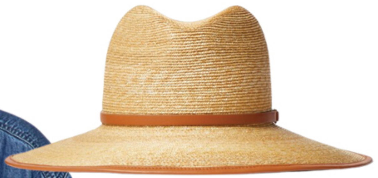
VALENTINO, R$ 5.900