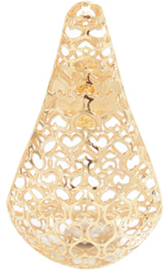
BRINCO GOTA, R$ 16.900