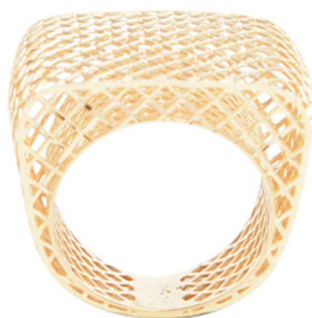
ANEL TELA, A PARTIR DE R$ 6.900