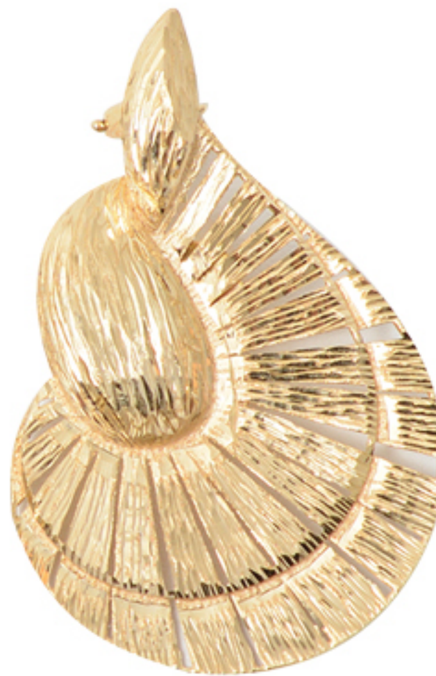
BRINCO FOLHA, R$ 24.900