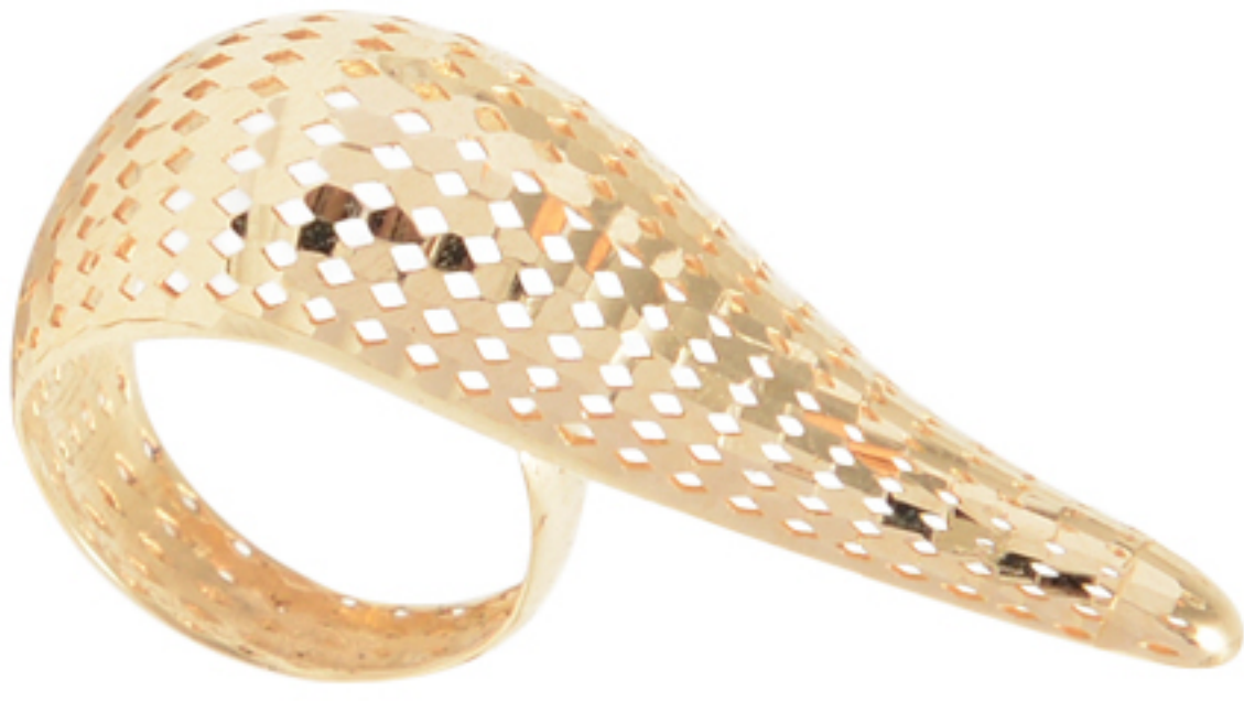
ANEL GOTA, R$ 7.900