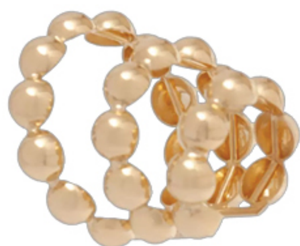
PIERCING TRIPLO, R$ 6.900