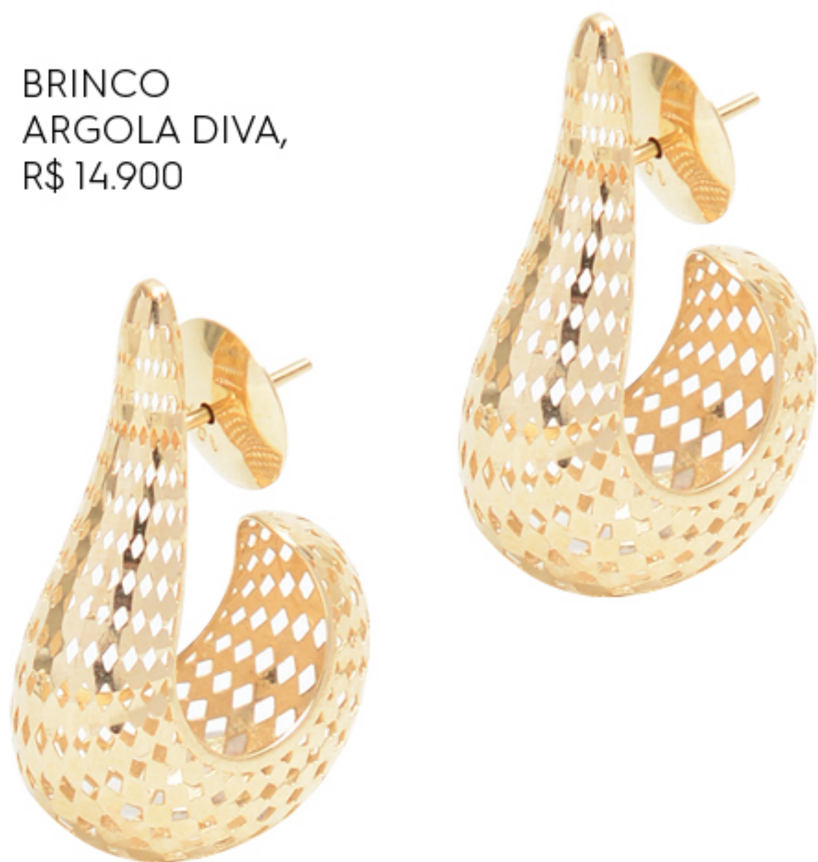
BRINCO ARGOLA DIVA, R$ 14.900