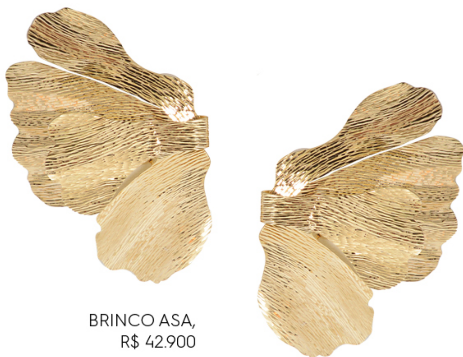
BRINCO ASA, R$ 42.900