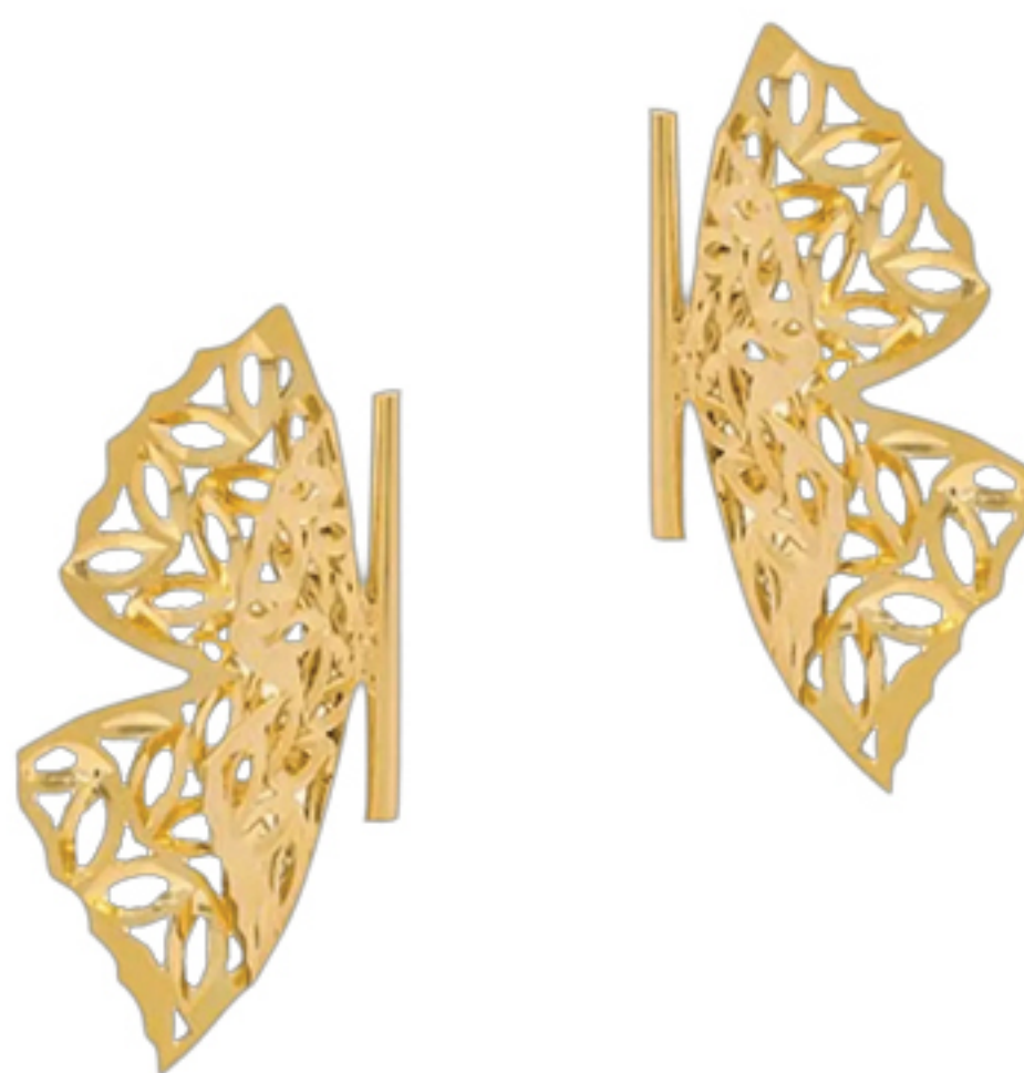
BRINCO BORBOLETA, R$ 6.900