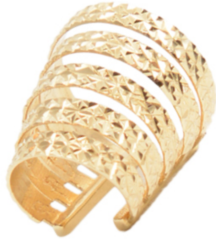
PIERCING DIVA 5 VOLTAS, R$ 5.900