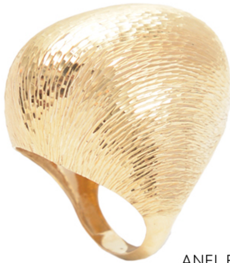
ANEL BOJUDO, R$ 16.900