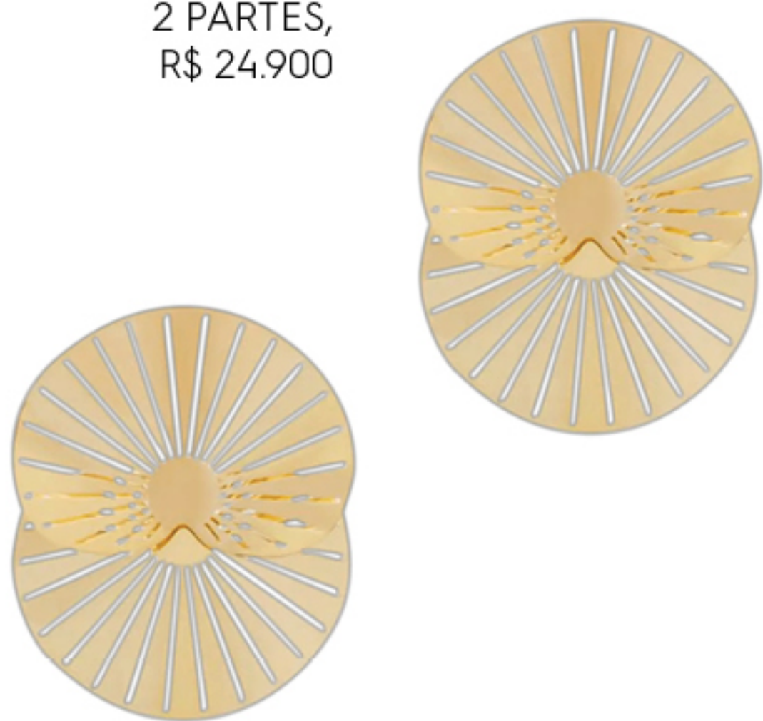
BRINCO LEQUE 2 PARTES, R$ 24.900