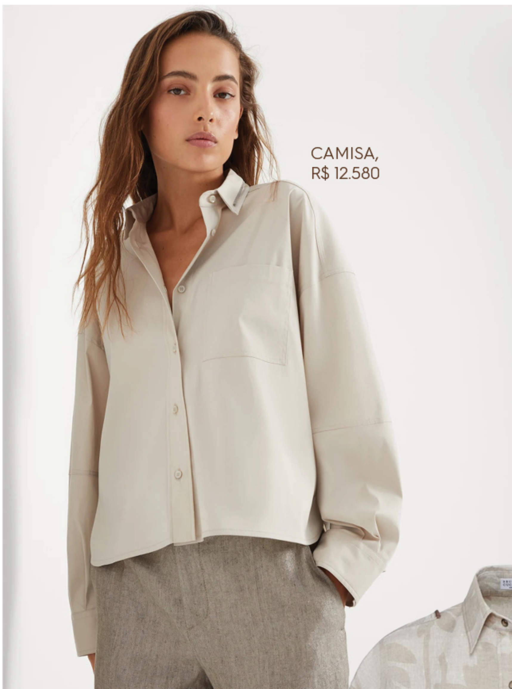
CAMISA, R$ 12.580