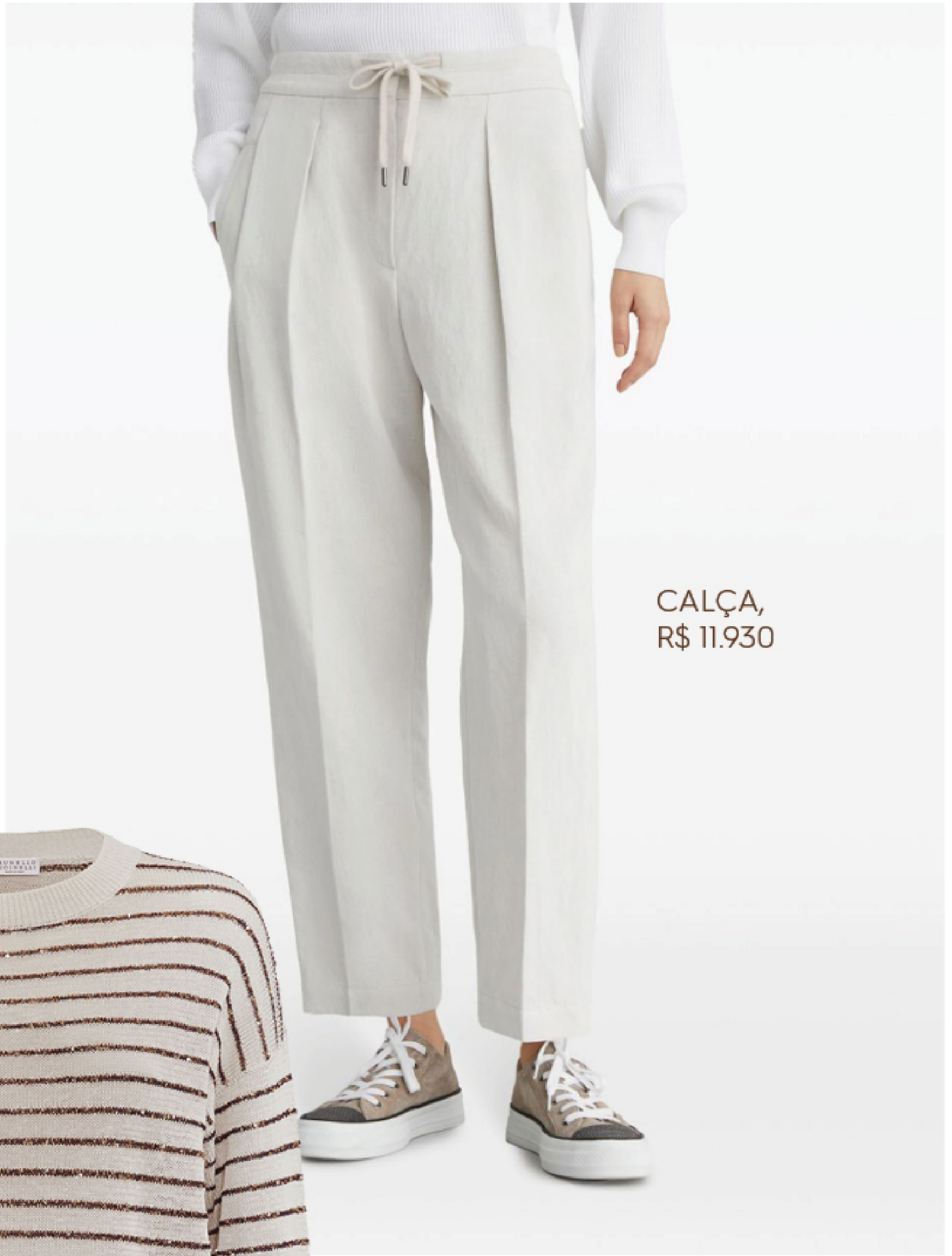
CALÇA, R$ 11.930