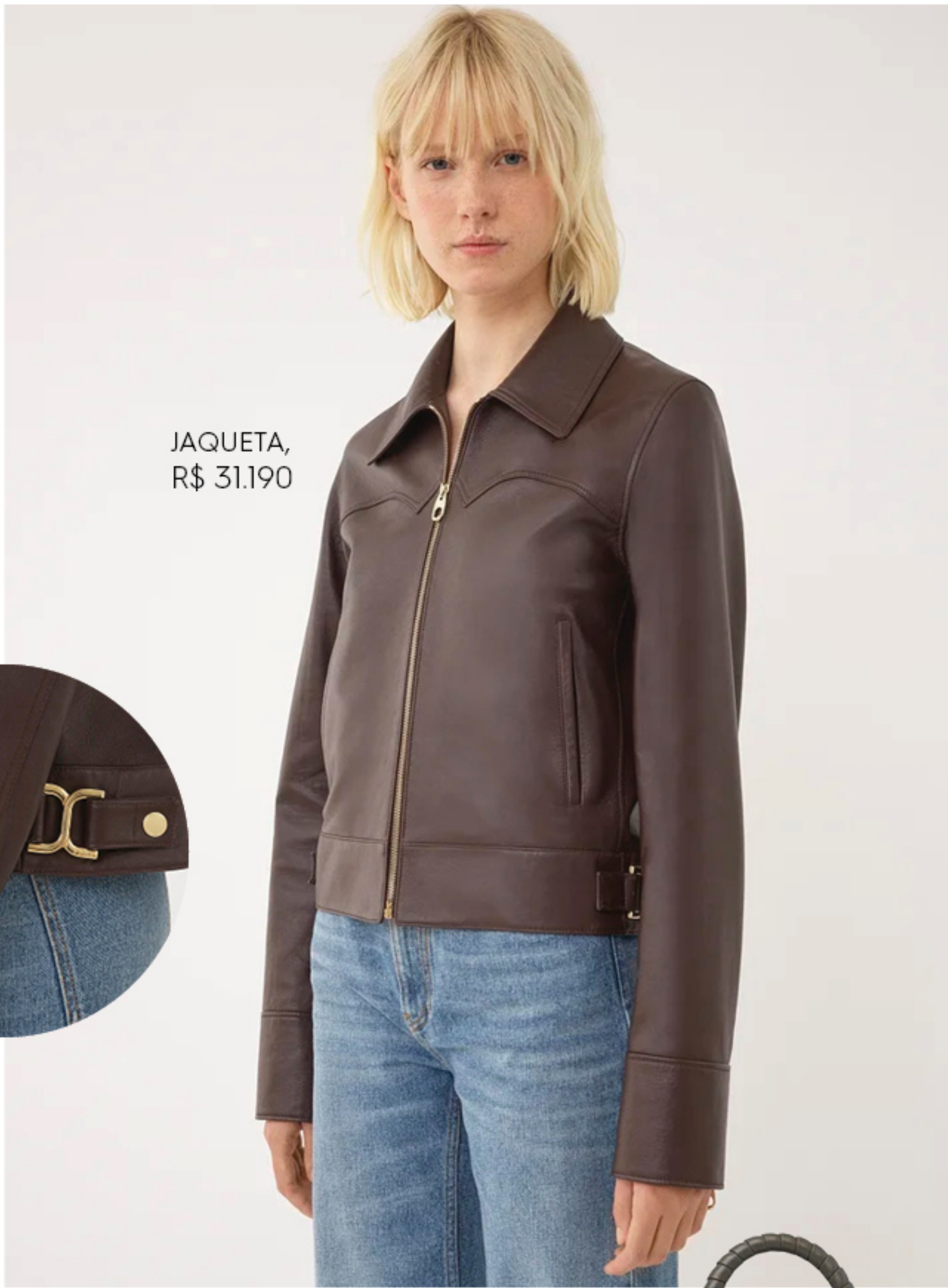
JAQUETA, R$ 31.190