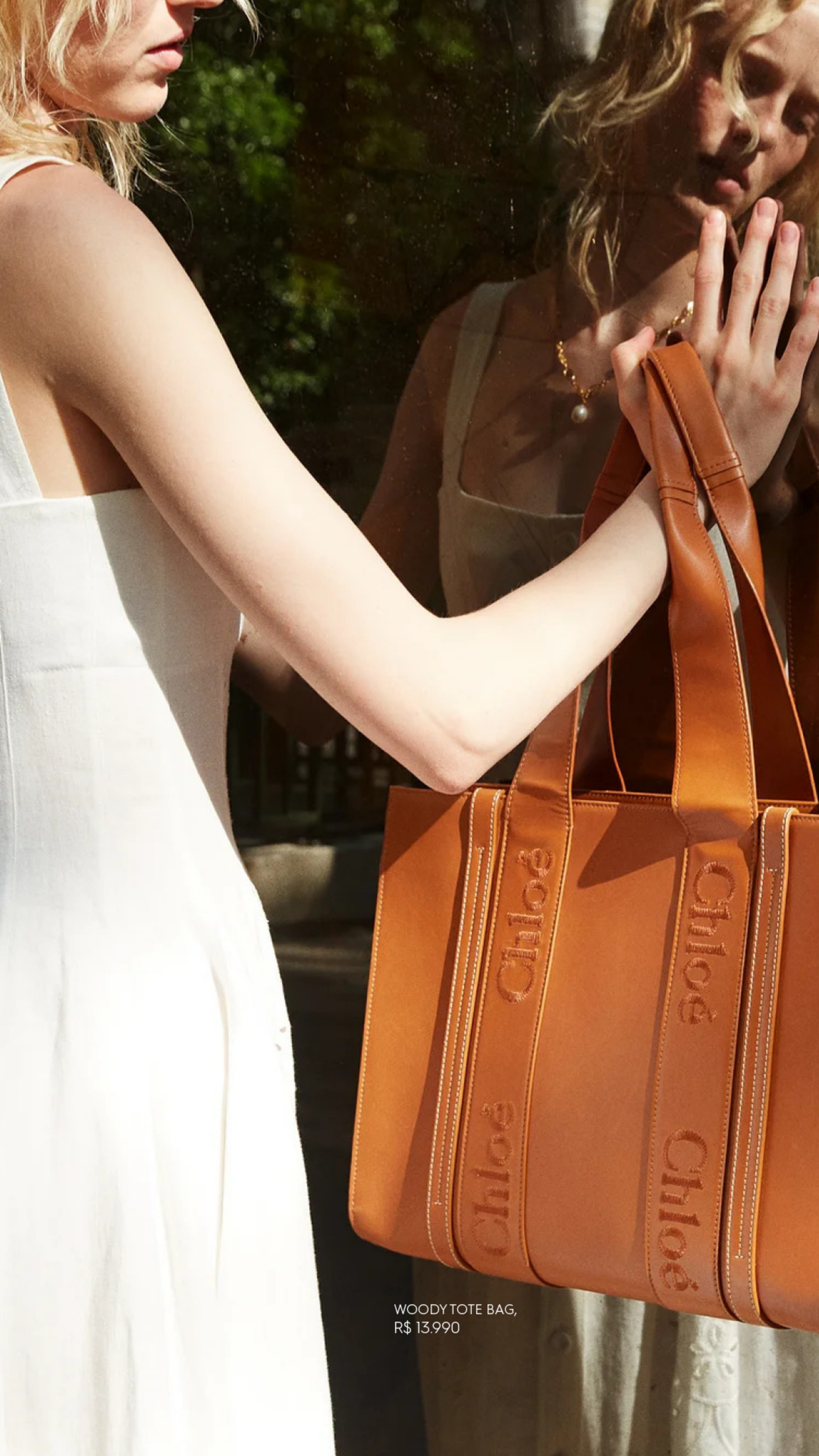
WOODY TOTE BAG, R$ 13.990