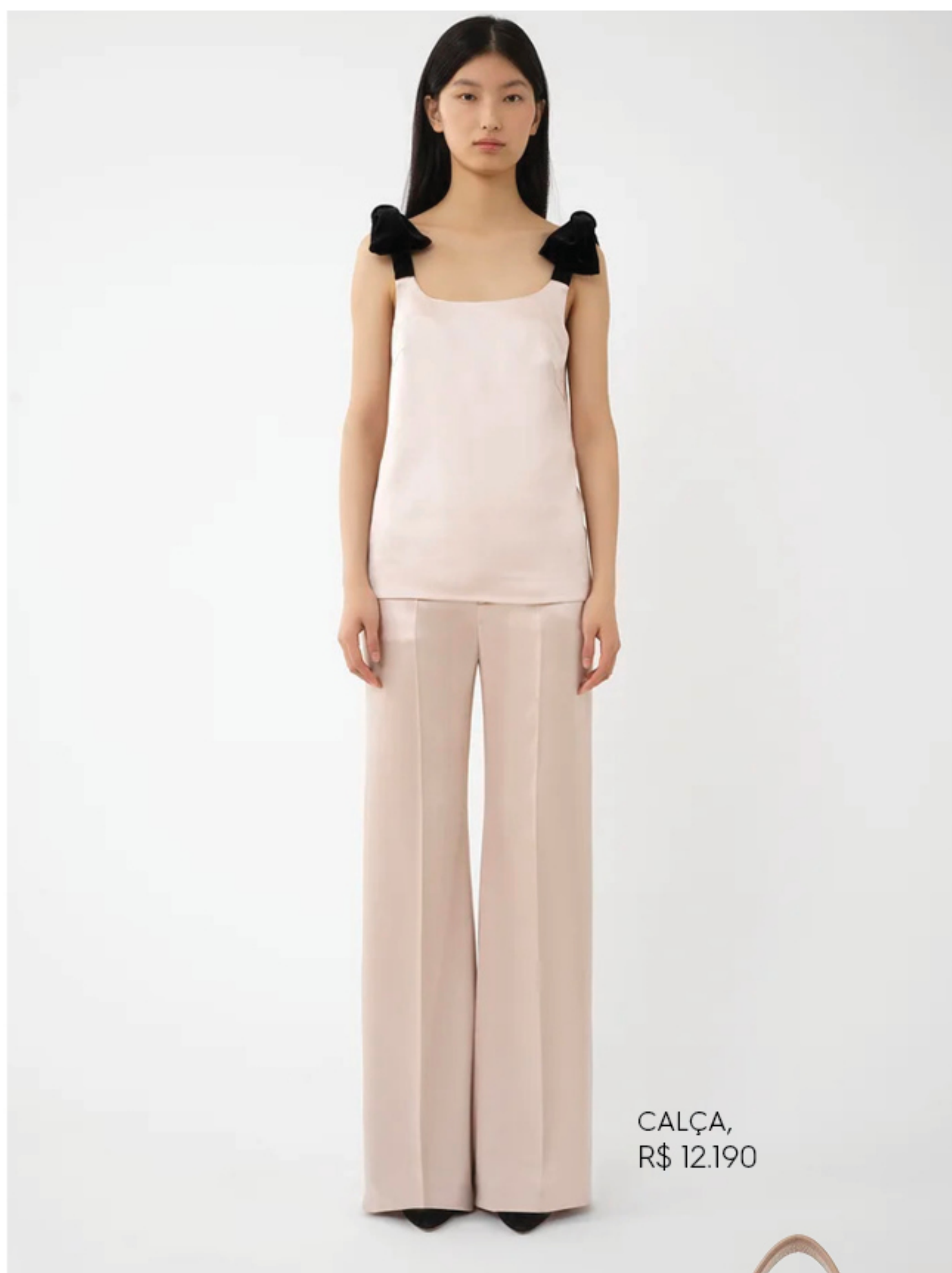
CALÇA, R$ 12.190