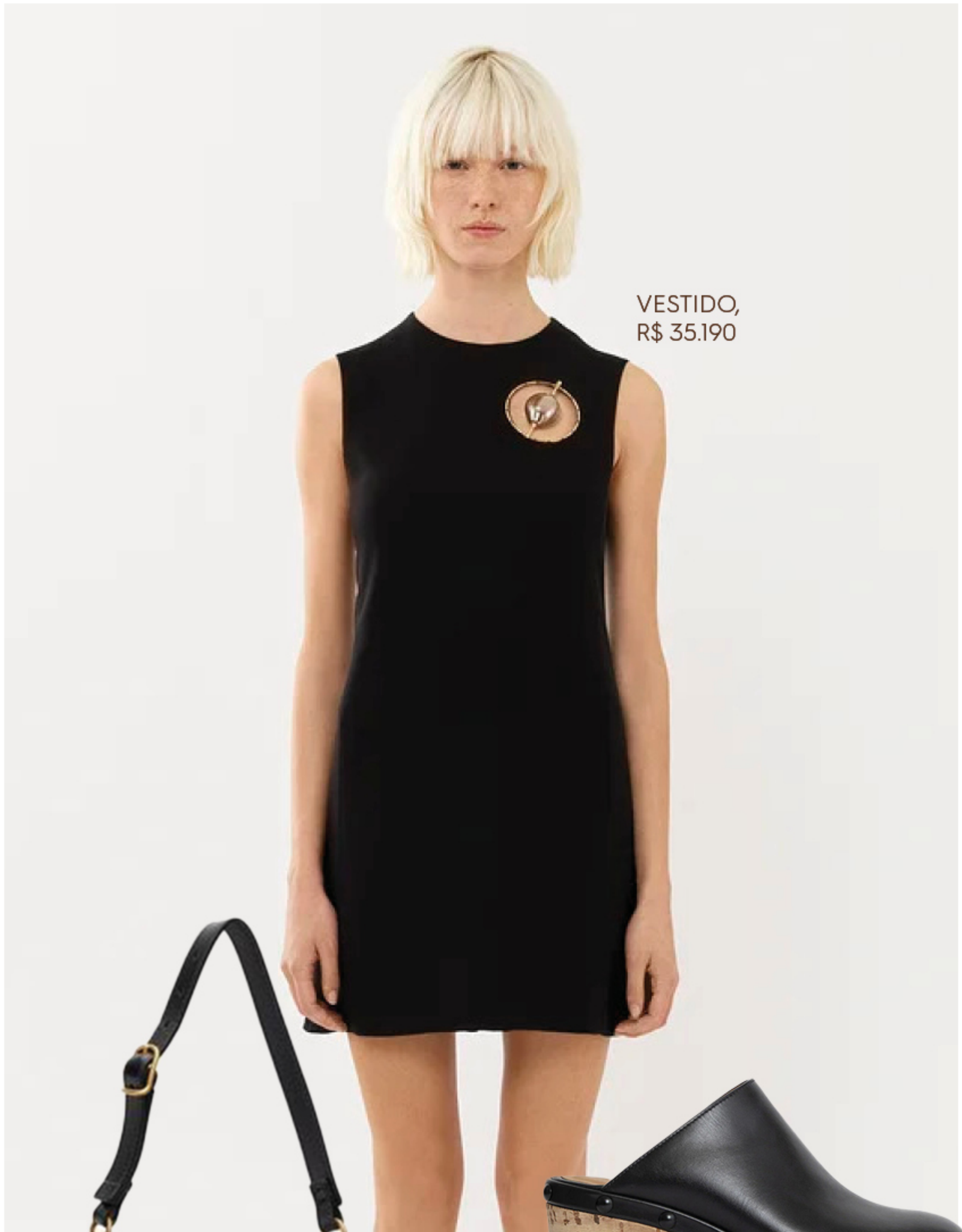
VESTIDO, R$ 35.190