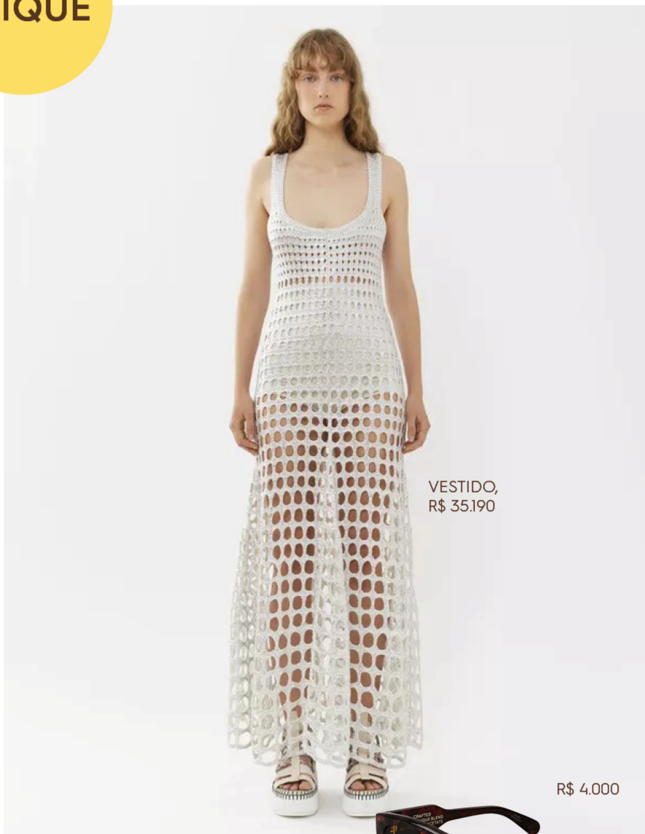
VESTIDO, R$ 35.190

NAS PÁGINAS PARA FALAR COM SUA PRIVATE SHOPPER