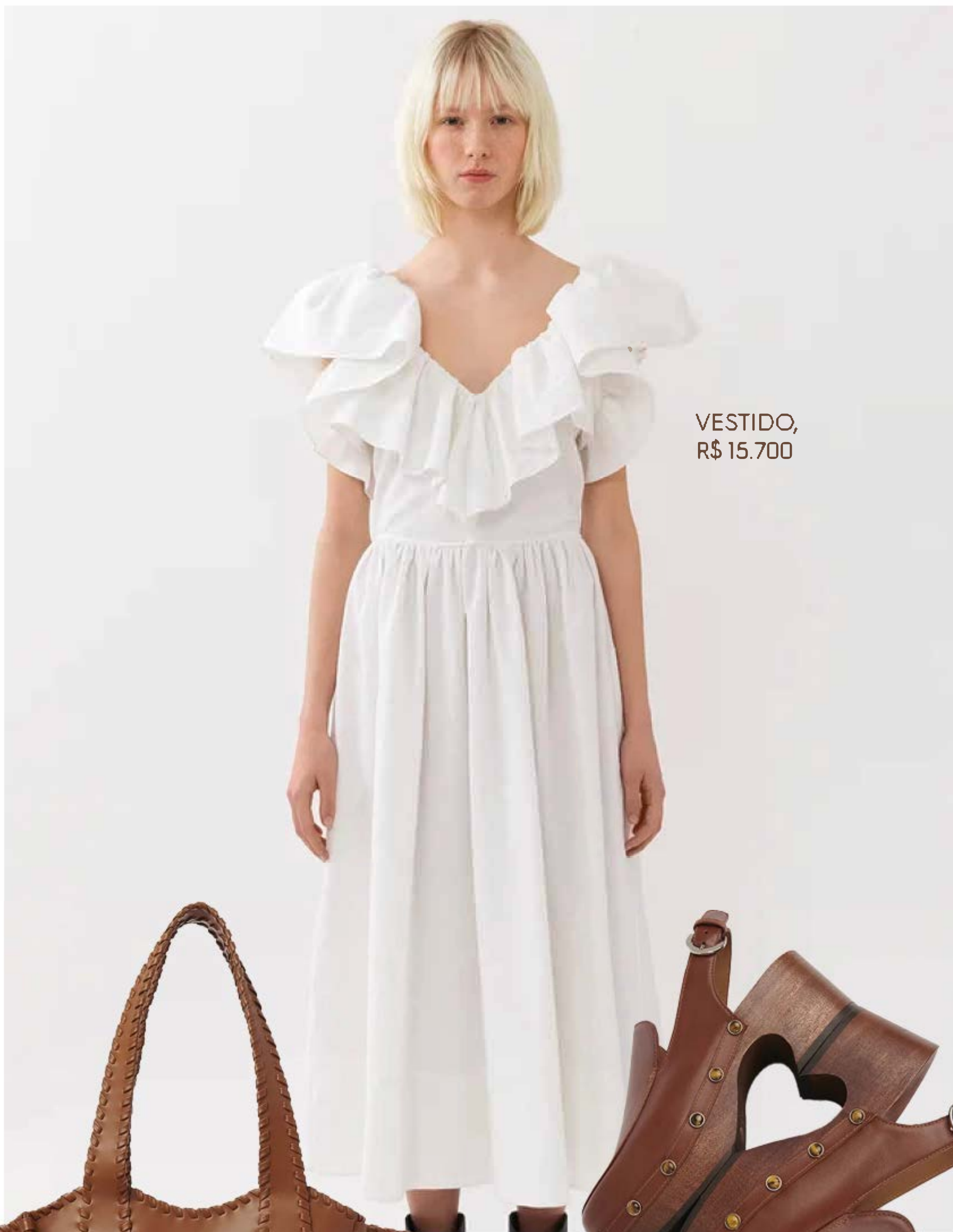
VESTIDO, R$ 15.700