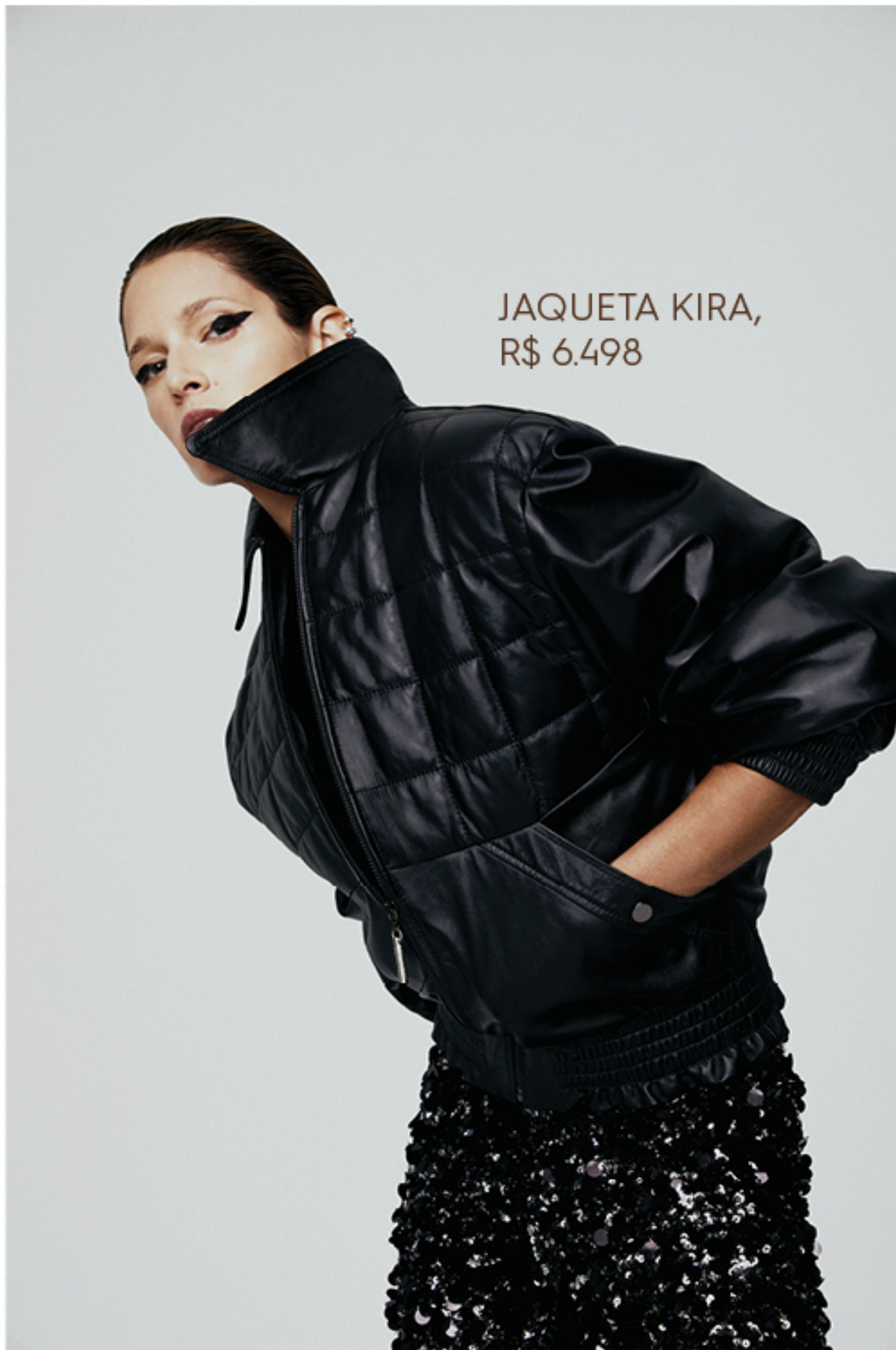
JAQUETA KIRA, R$ 6.498