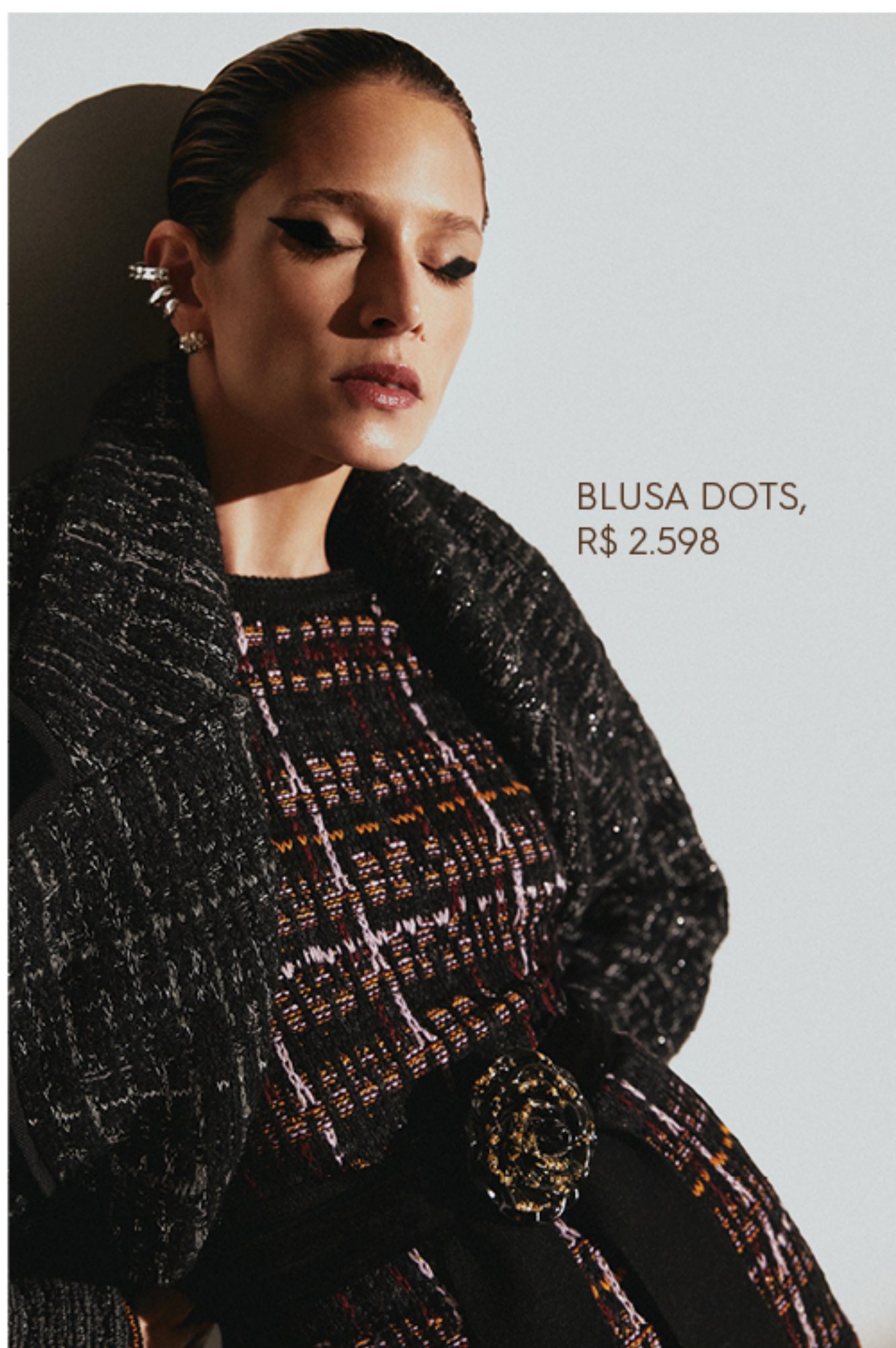
BLUSA DOTS, R$ 2.598