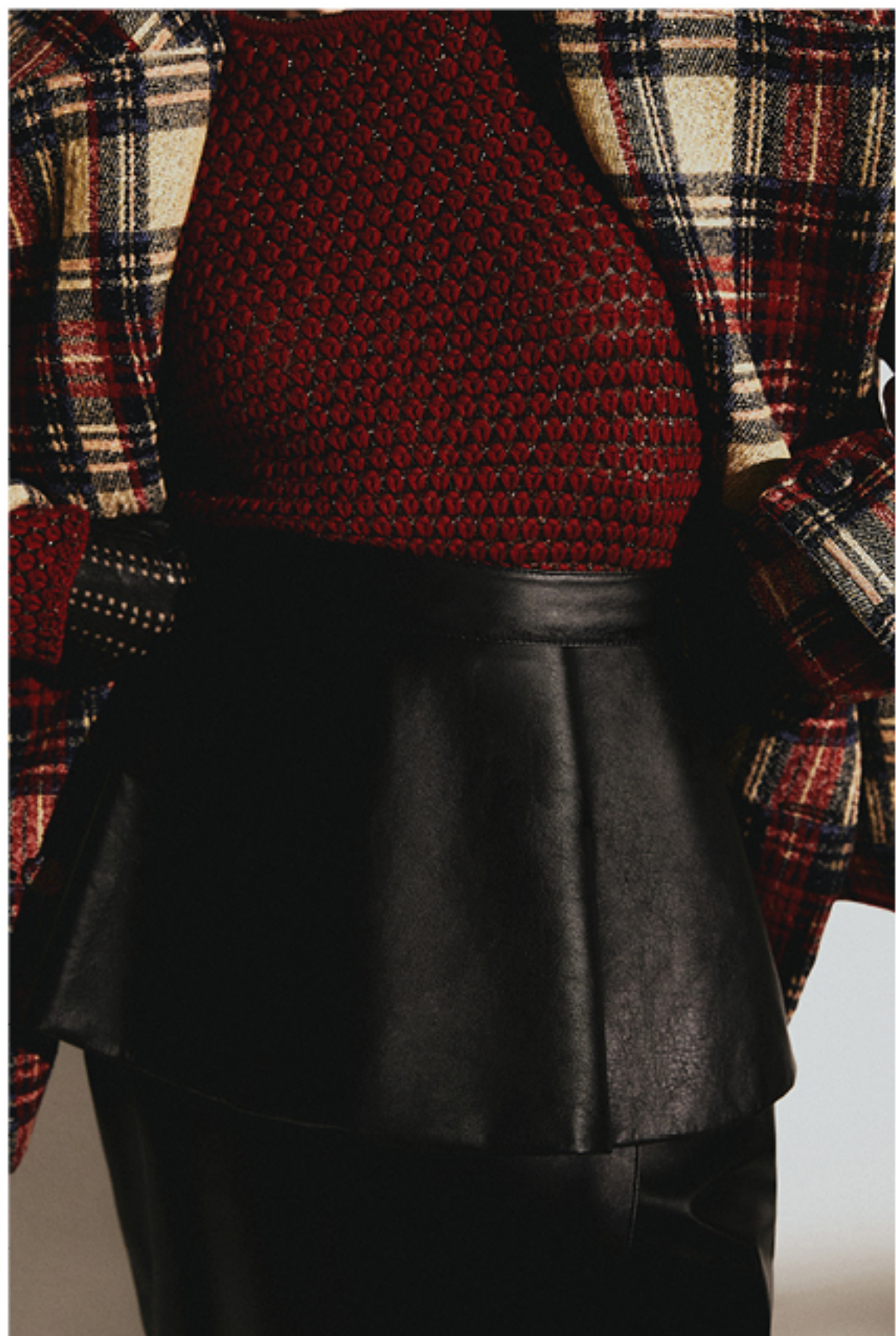
SAIA VITRE, R$ 10.998