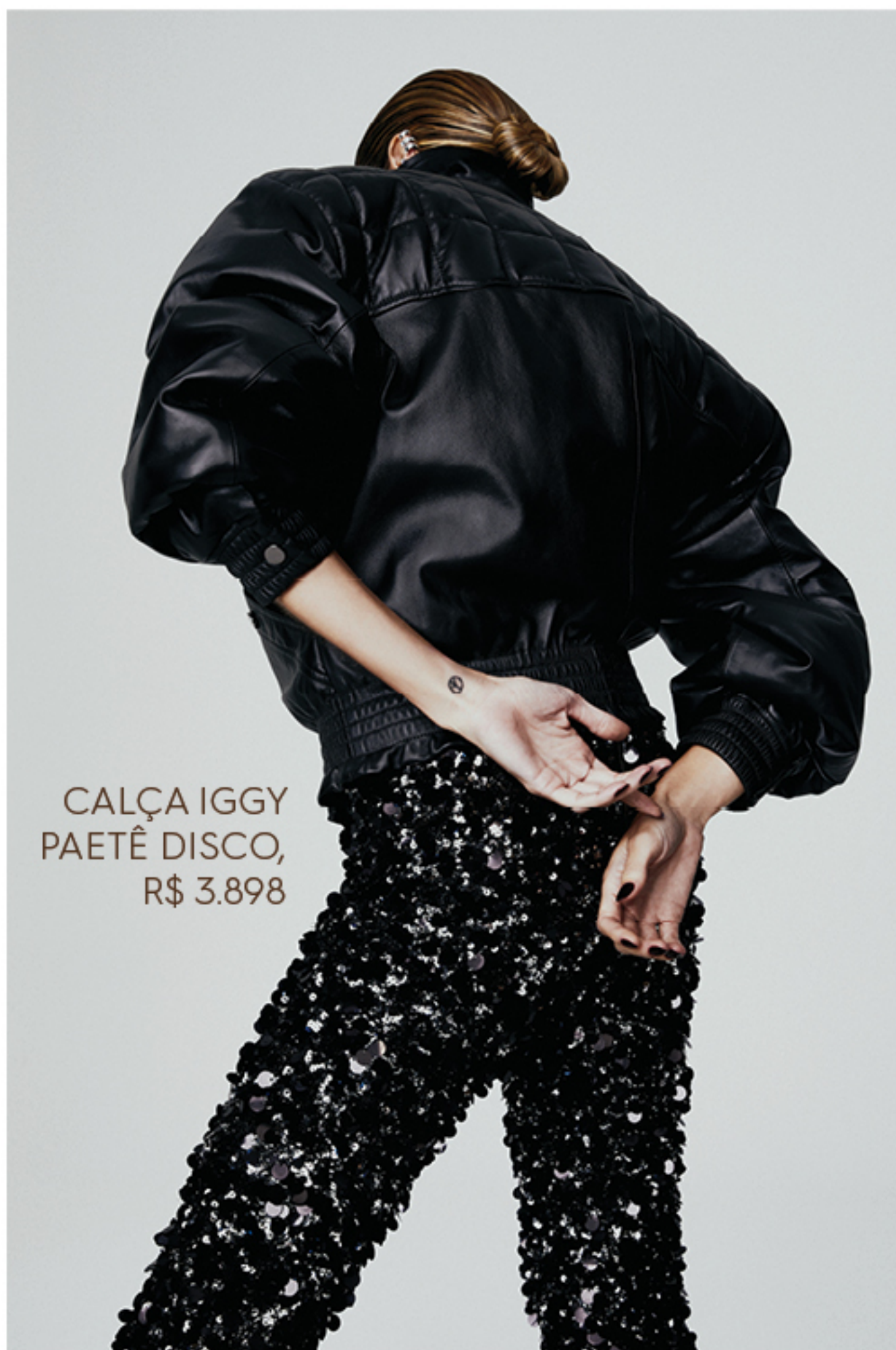
CALÇA IGGY PAETÊ DISCO, R$ 3.898