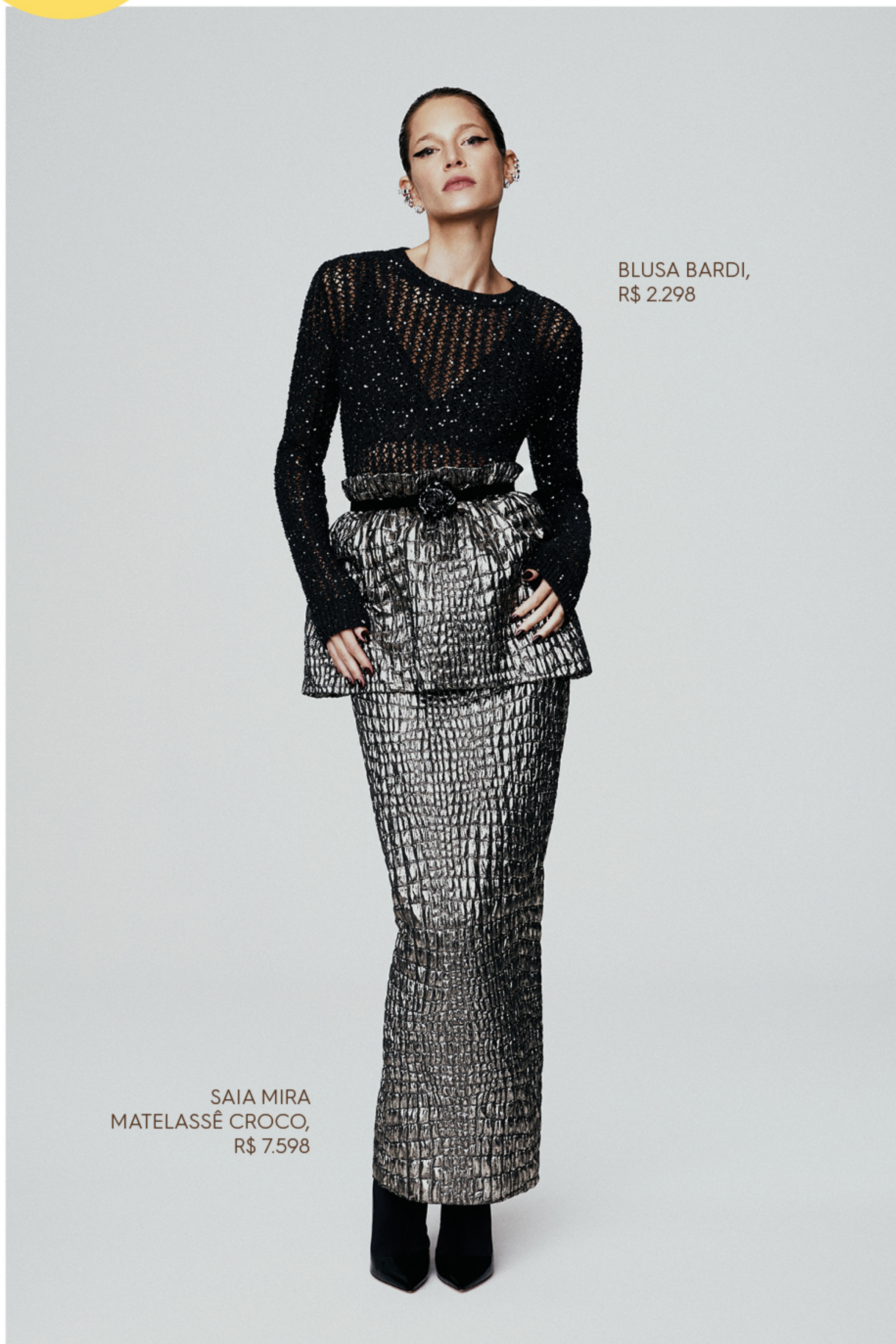
BLUSA BARDI, R$ 2.298

NAS PÁGINAS PARA FALAR COM SUA PRIVATE SHOPPER