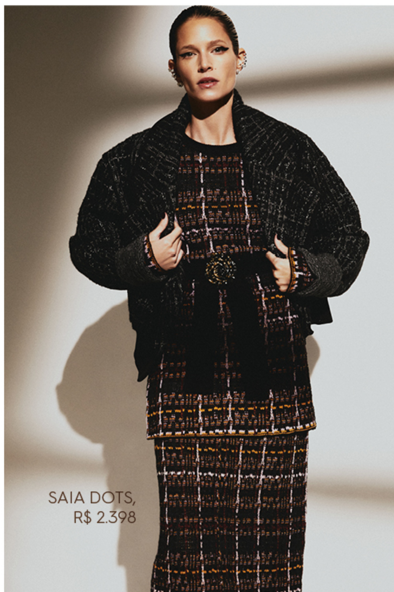
SAIA DOTS, R$ 2.398