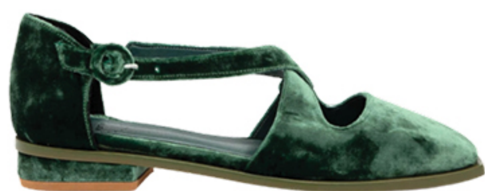
MANOLITA, R$ 1.160,50