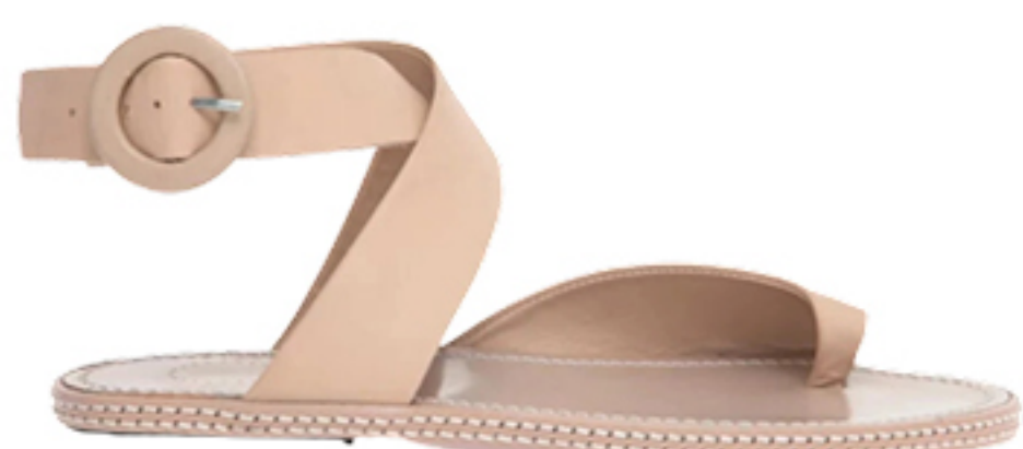
MANOLITA, R$ 829,50