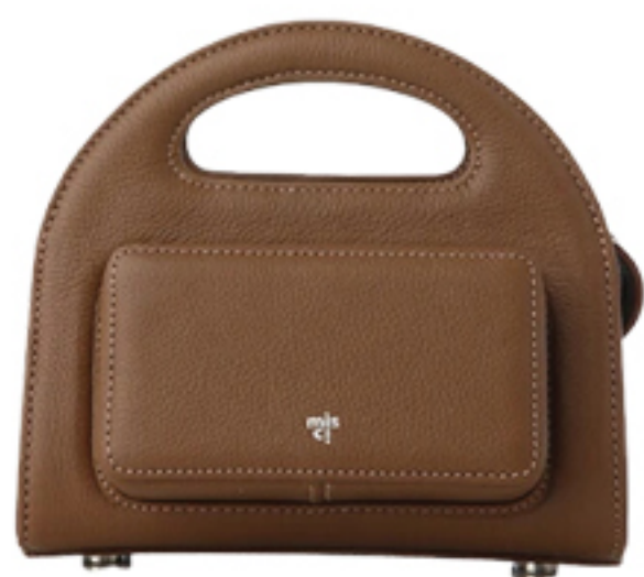
MISCI, R$ 2.080