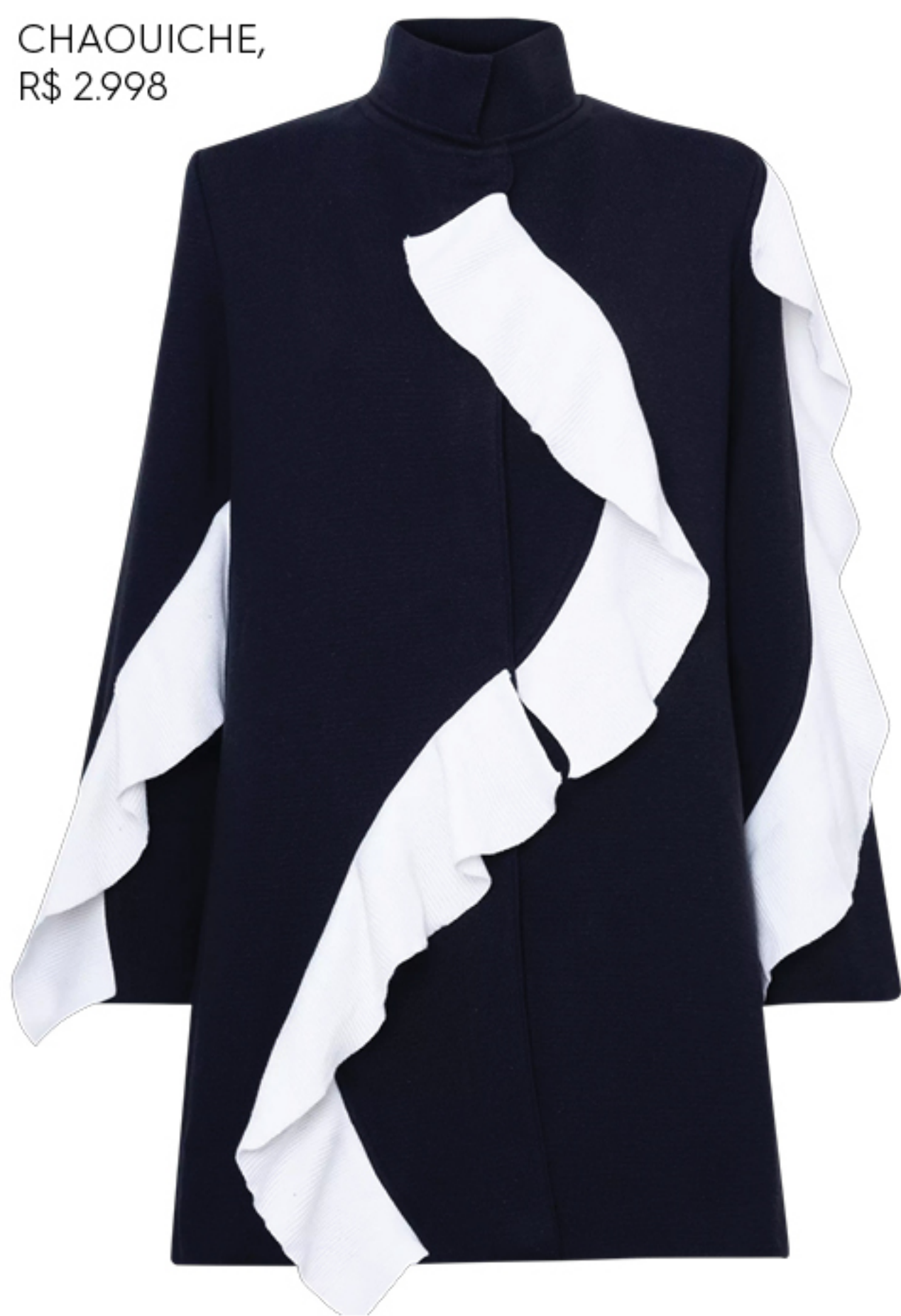
CHAOUCHE, R$ 2.998