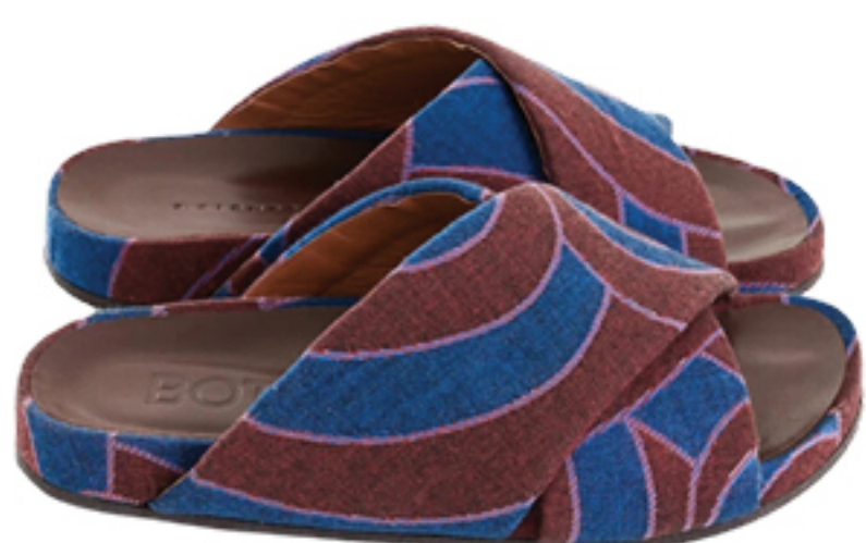
BOTTI, R$ 1.380