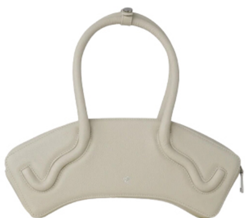
MISCI, R$ 2.180

NAS PÁGINAS PARA FALAR COM SUA PRIVATE SHOPPER