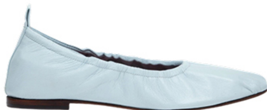
MANOLITA, R$ 1.350