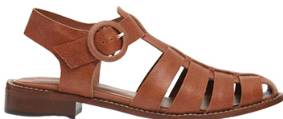
MANOLITA, R$ 819,50