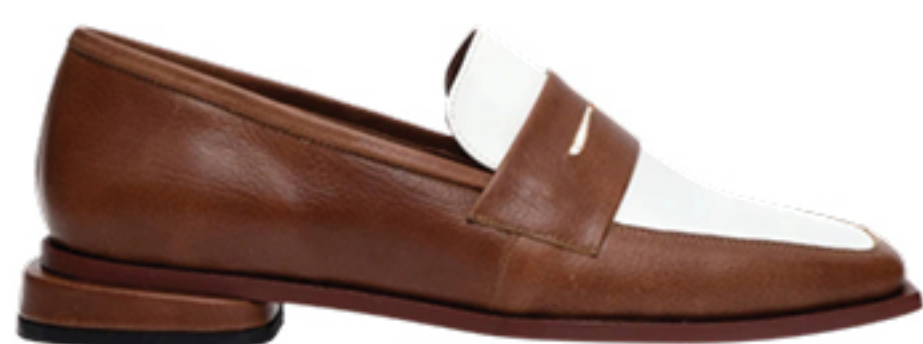
MANOLITA, R$ 989,50