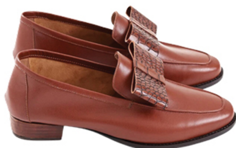
BOTTI, R$ 1.438