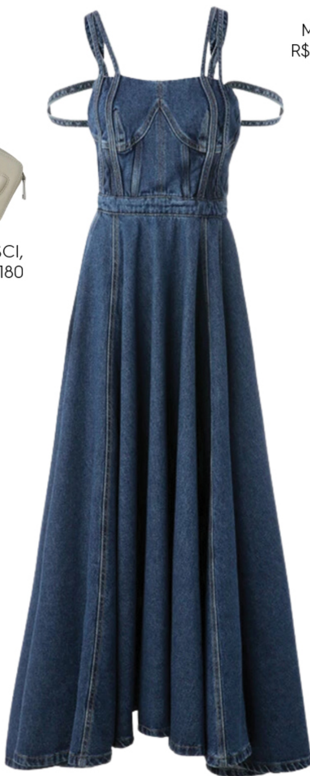
MISCI, R$ 1.880