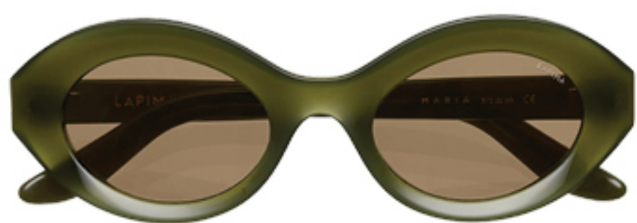
LAPIMA, R$ 3.170