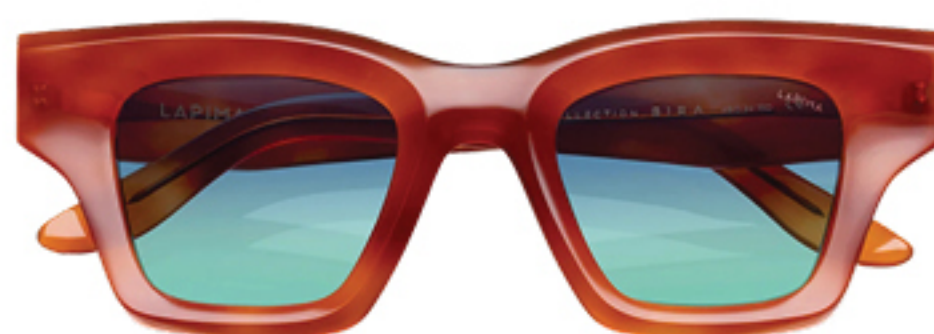
LAPIMA, R$ 3.370