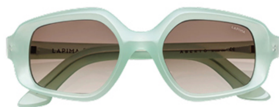
LAPIMA, R$ 3.270