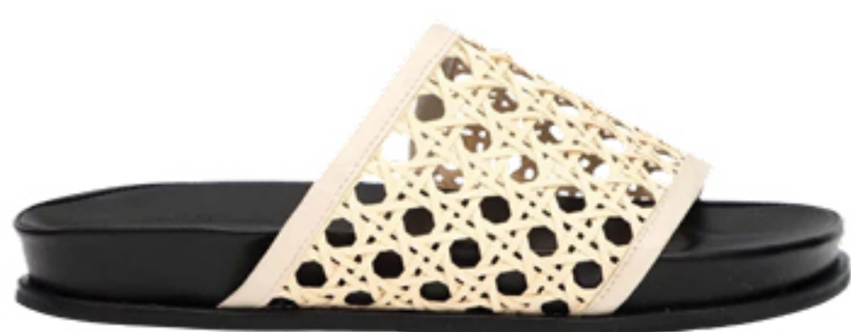
MANOLITA, R$ 920,50