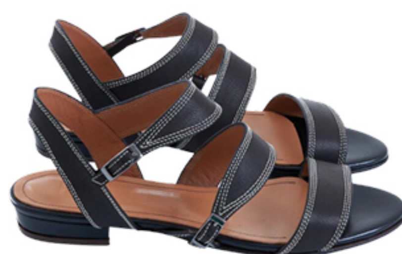
BOTTI, R$ 1.269