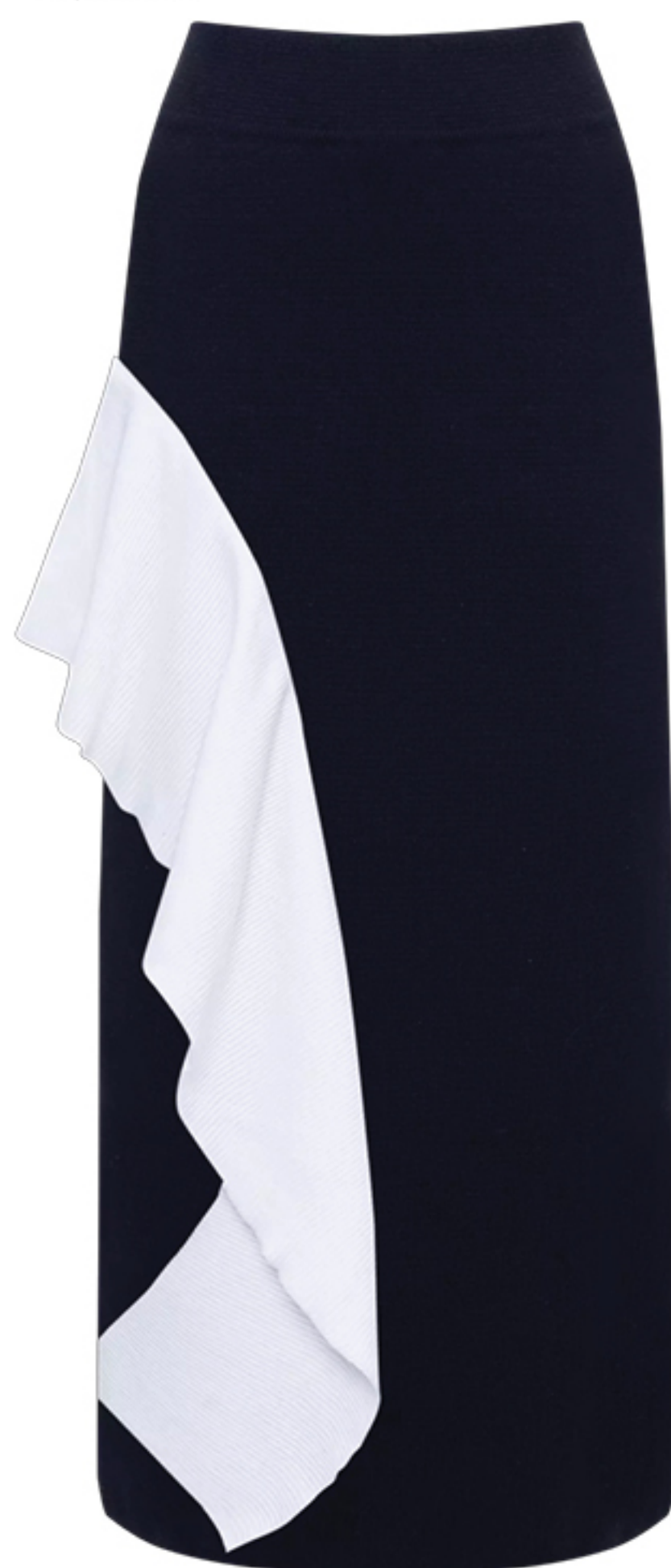
CHAOUCHE, R$ 1.798