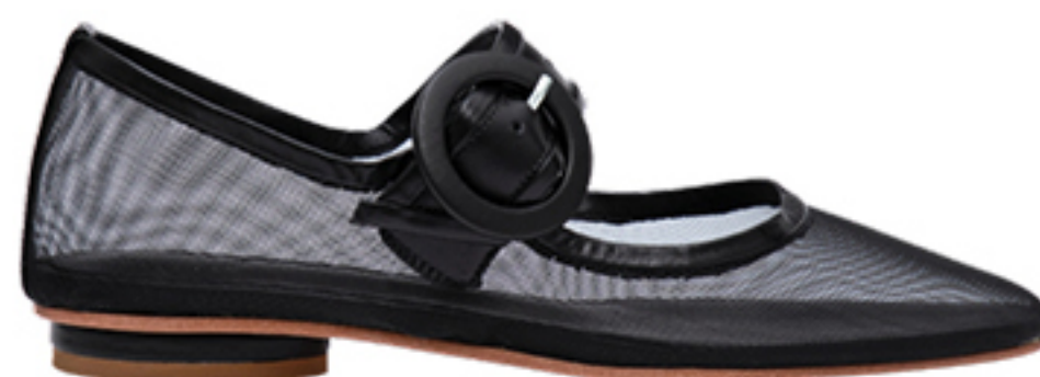
MANOLITA, R$ 880,50