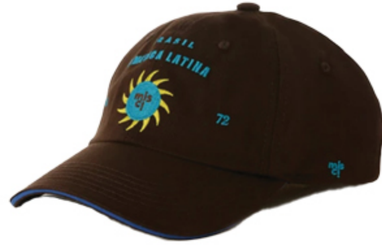
MISCI, R$ 240