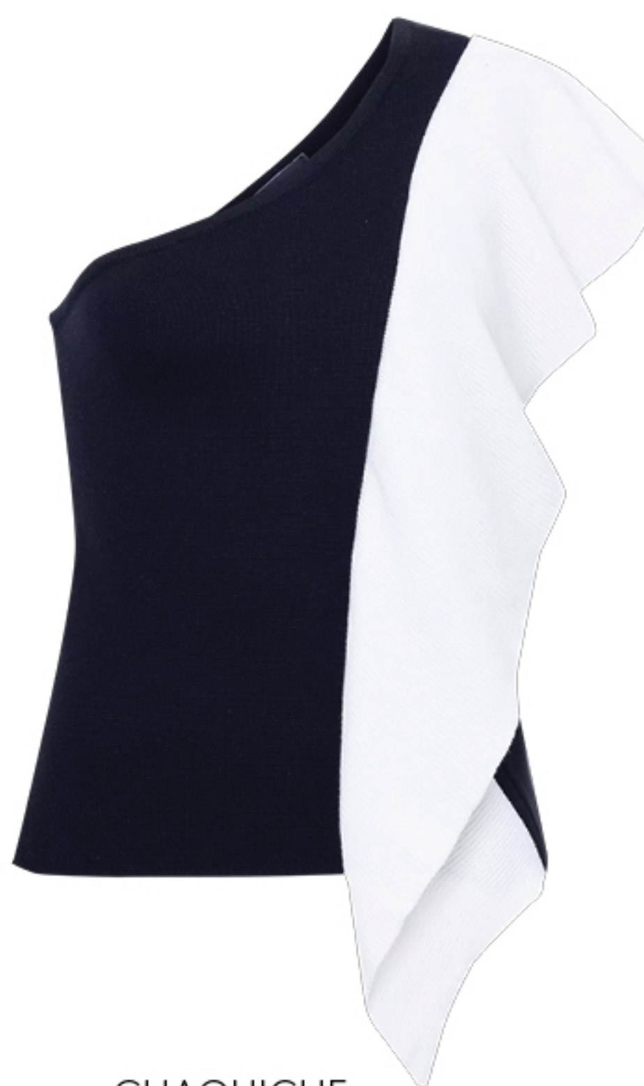
CHAOUCHE, R$ 1.498