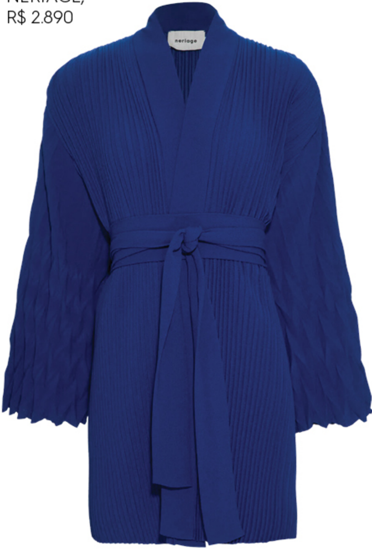
NERIAGE, R$ 2.890