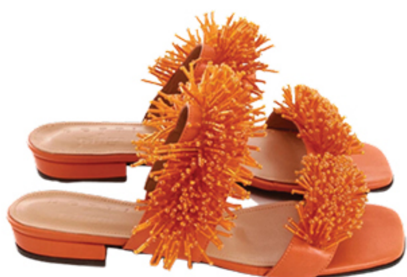
BOTTI, R$ 1.790