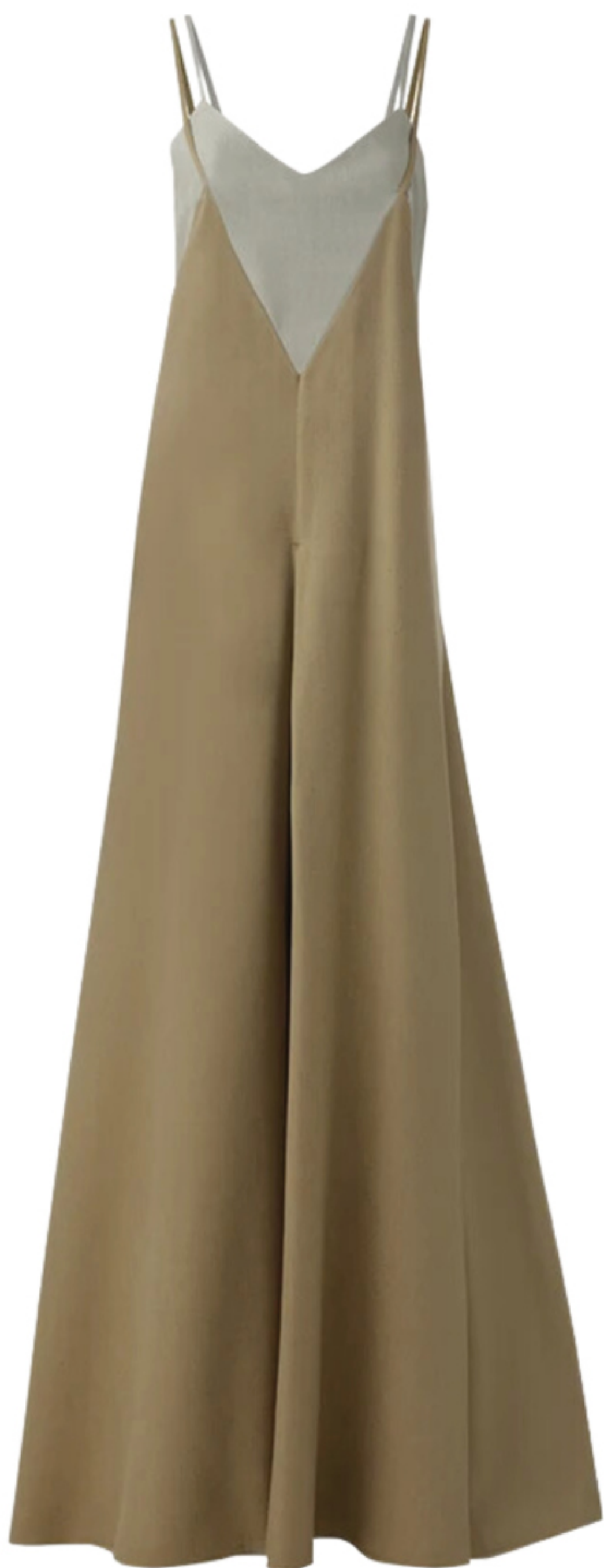
MISCI, R$ 2.980