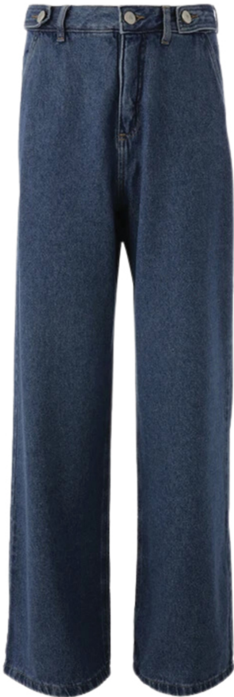
MISCI, R$ 880