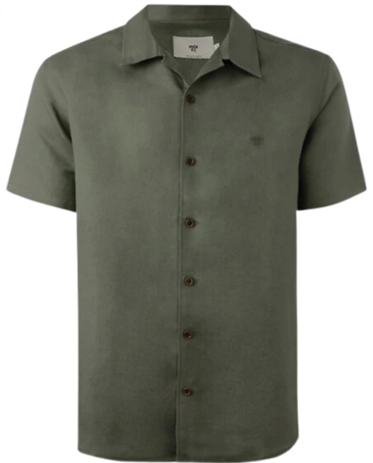
MISCI, R$ 590