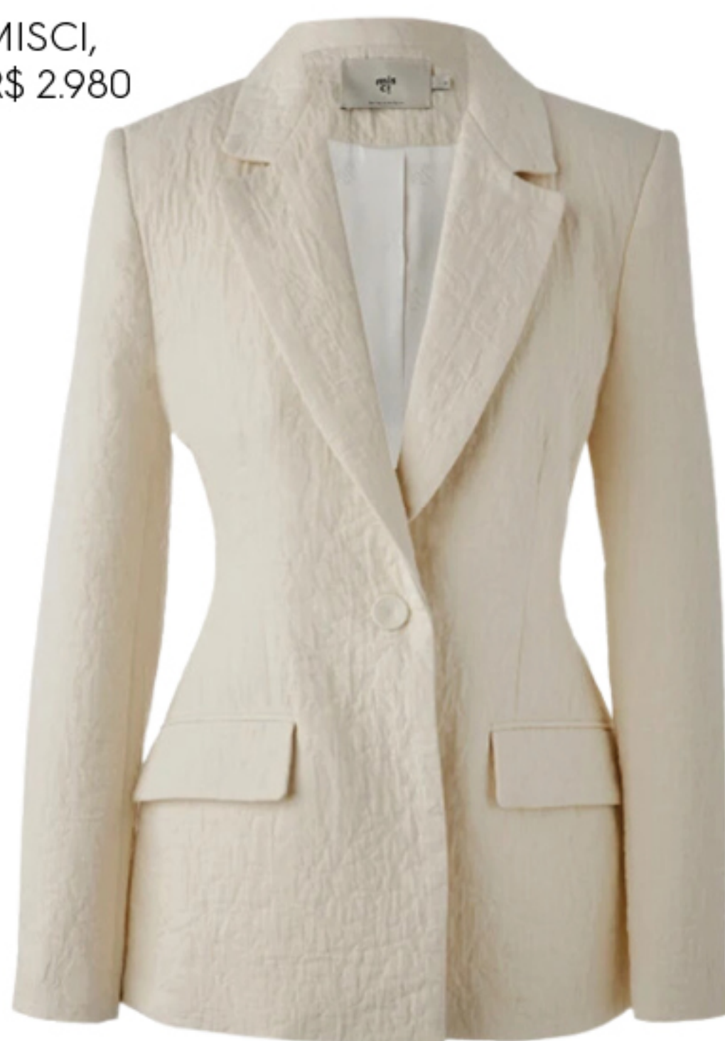
MISCI, R$ 2.980