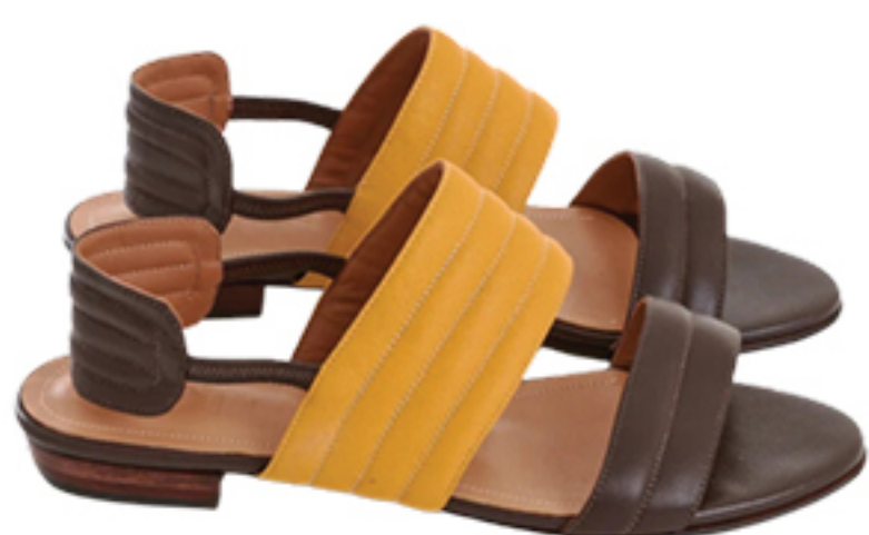
BOTTI, R$ 1.118