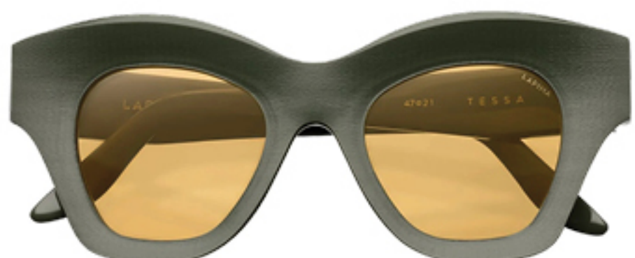
LAPIMA, R$ 3.270