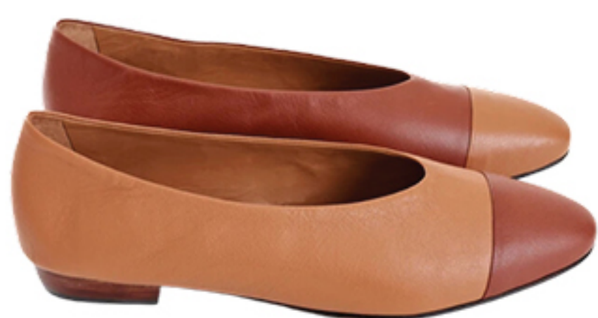
BOTTI, R$ 1.249