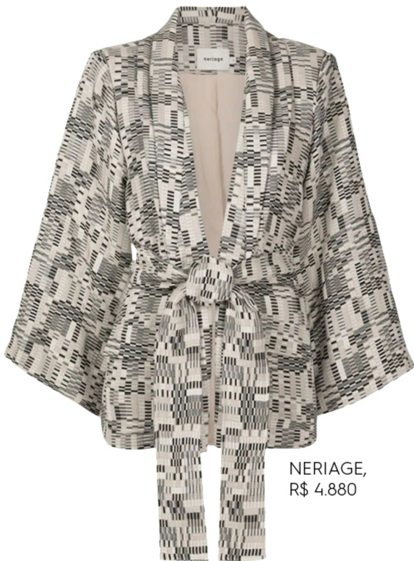
NERIAGE, R$ 4.880