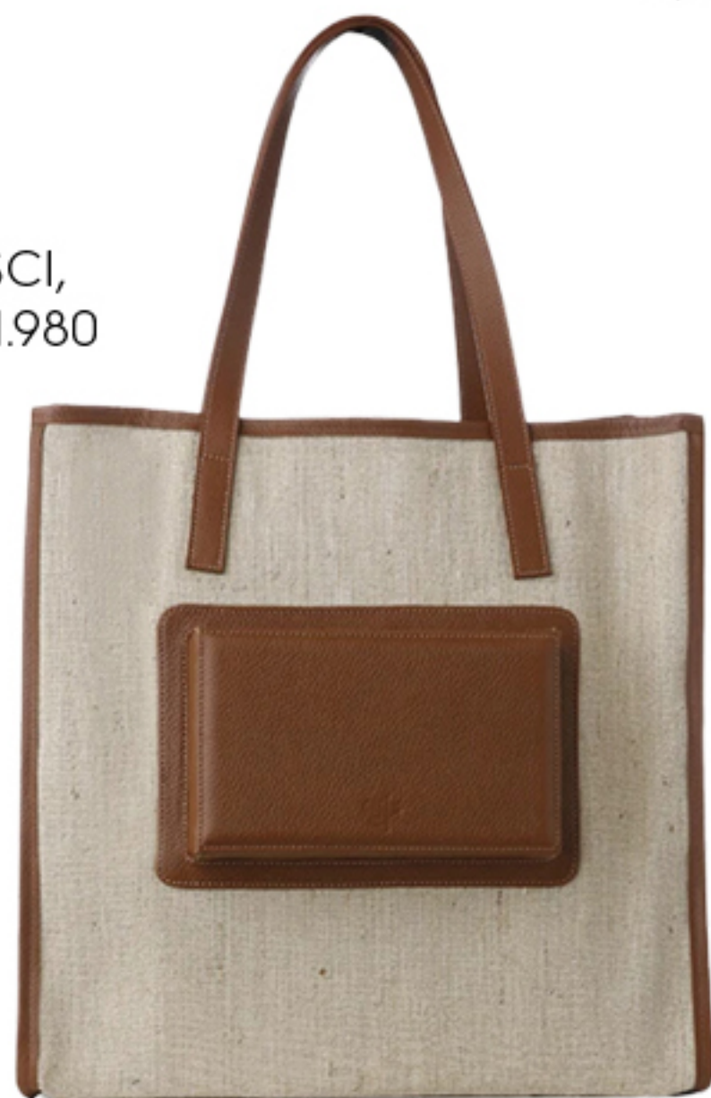
MISCI, R$ 1.980