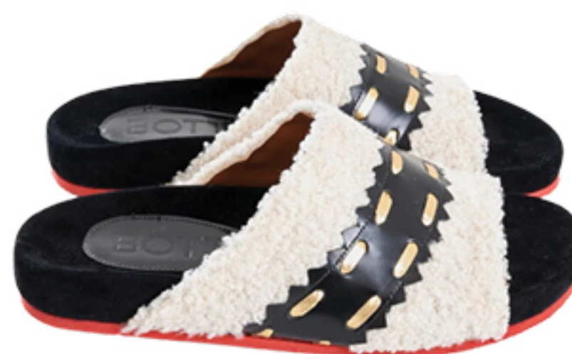
BOTTI, R$ 990