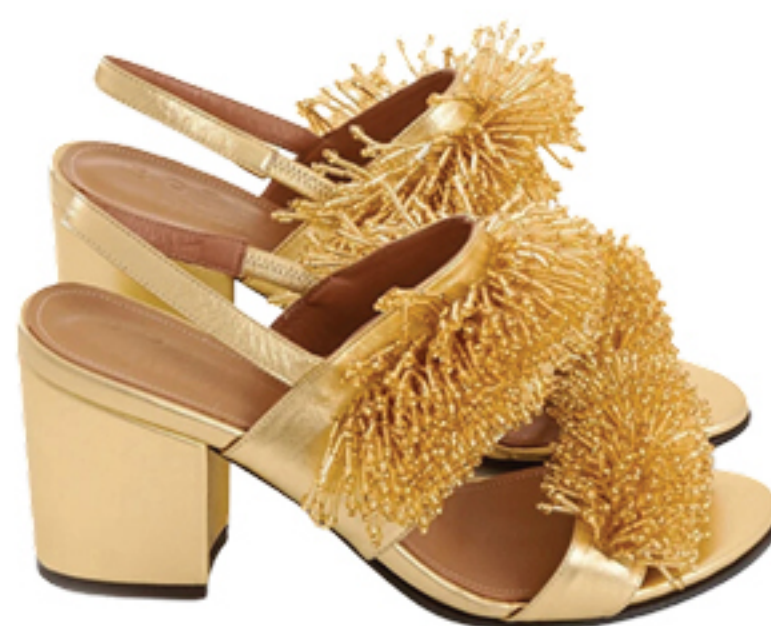
BOTTI, R$ 2.190