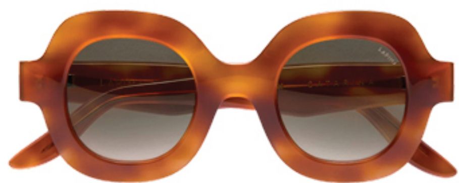
LAPIMA, R$ 2.970