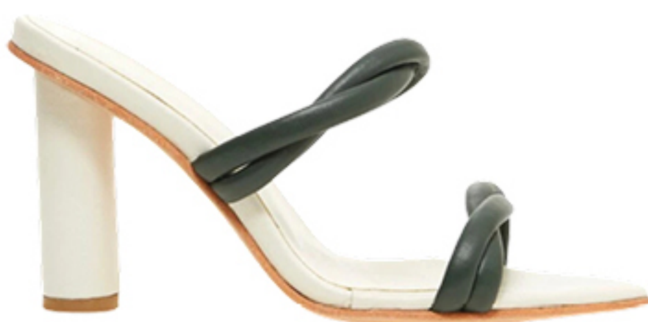
MANOLITA, R$ 889,50