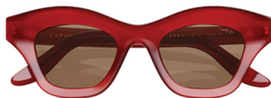
LAPIMA, R$ 3.070