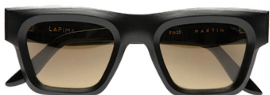
LAPIMA, R$ 3.170