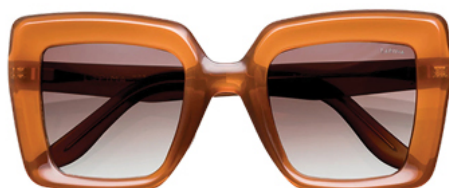
LAPIMA, R$ 3.270