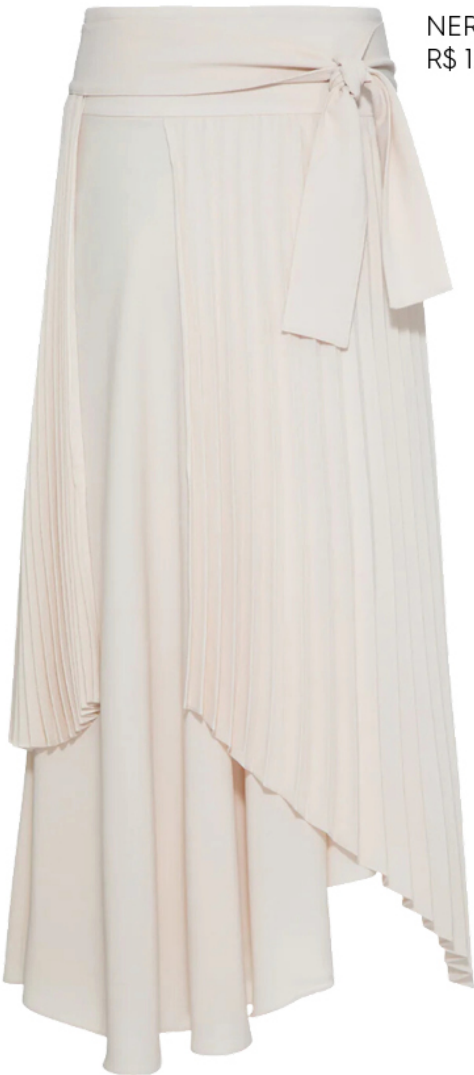
NERIAGE, R$ 1.880