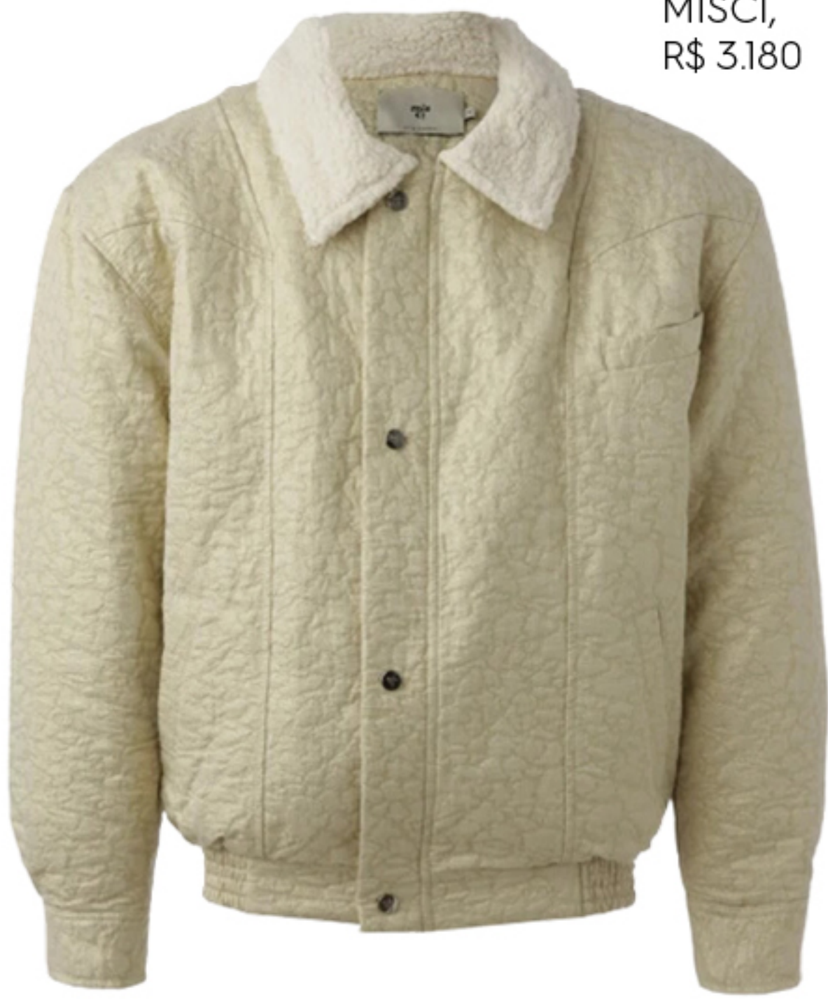
MISCI, R$ 3.180