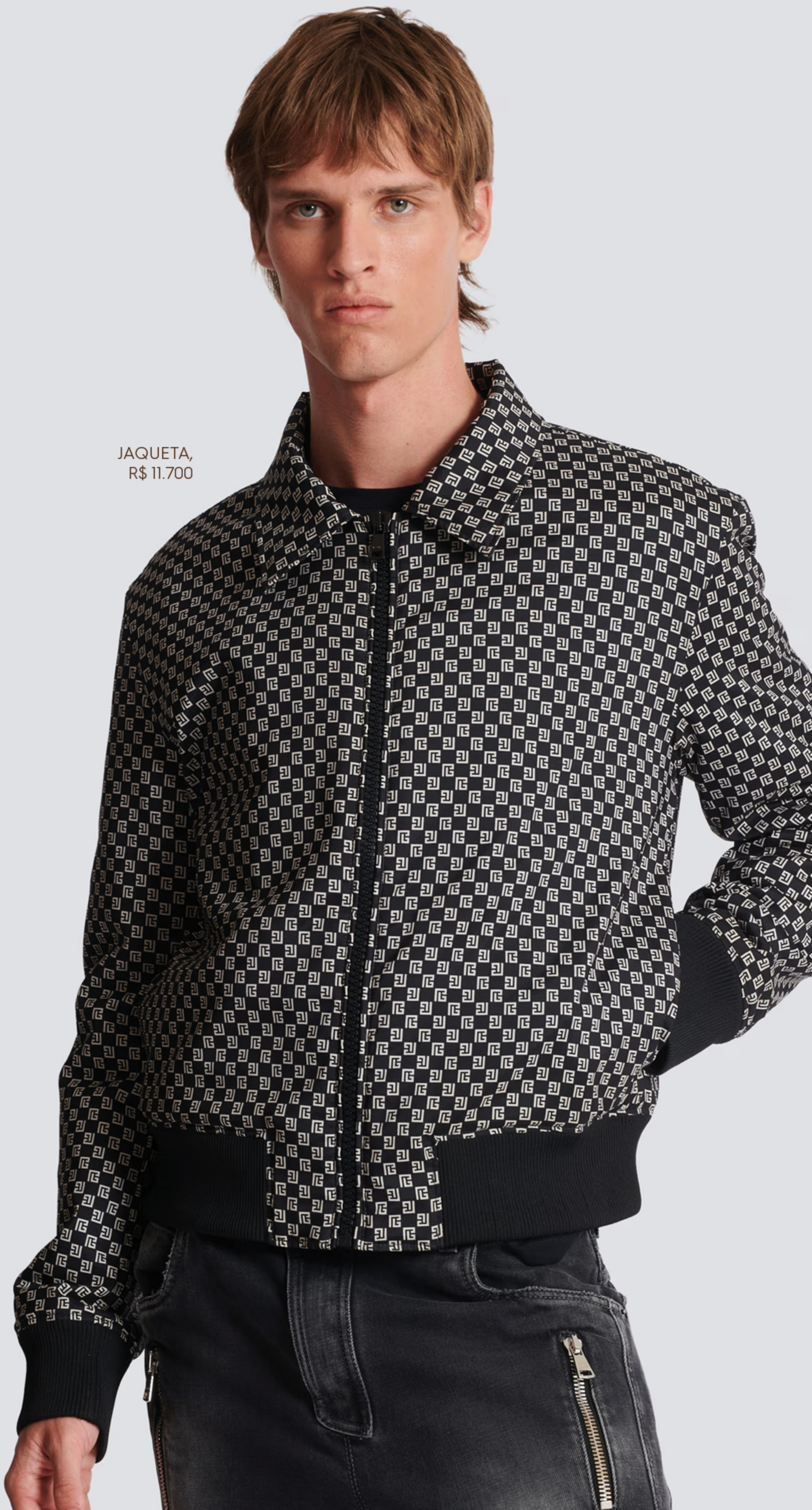
JAQUETA, R$ 11.700