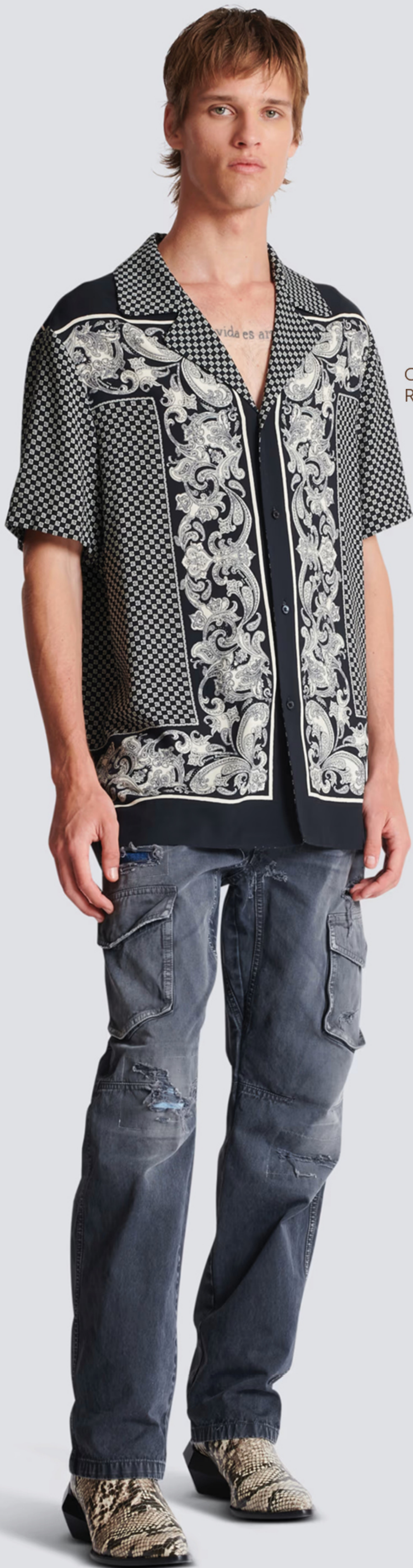
CAMISA, R$ 6.699